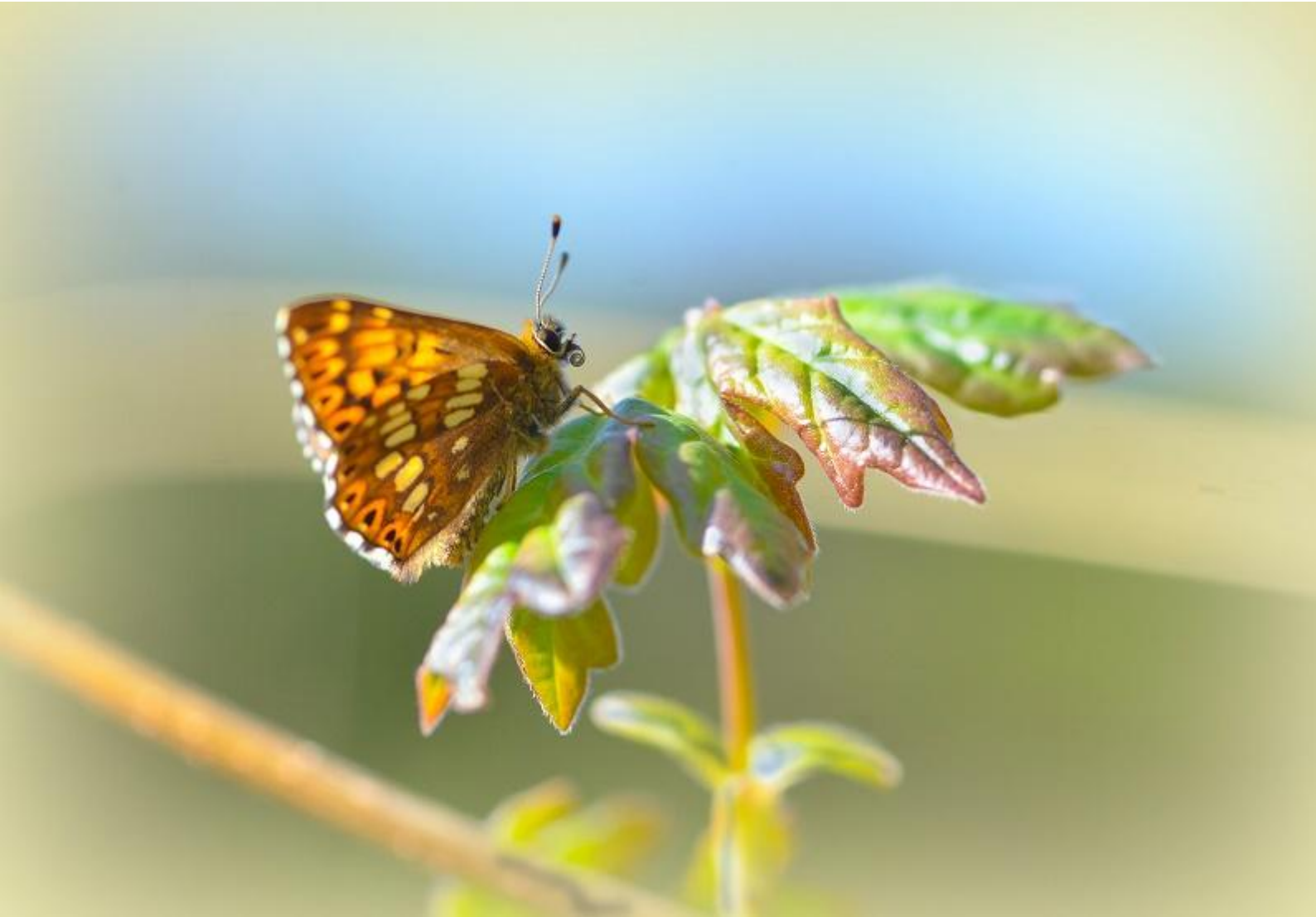
rjavi šekavček ( Flamearis lucina )