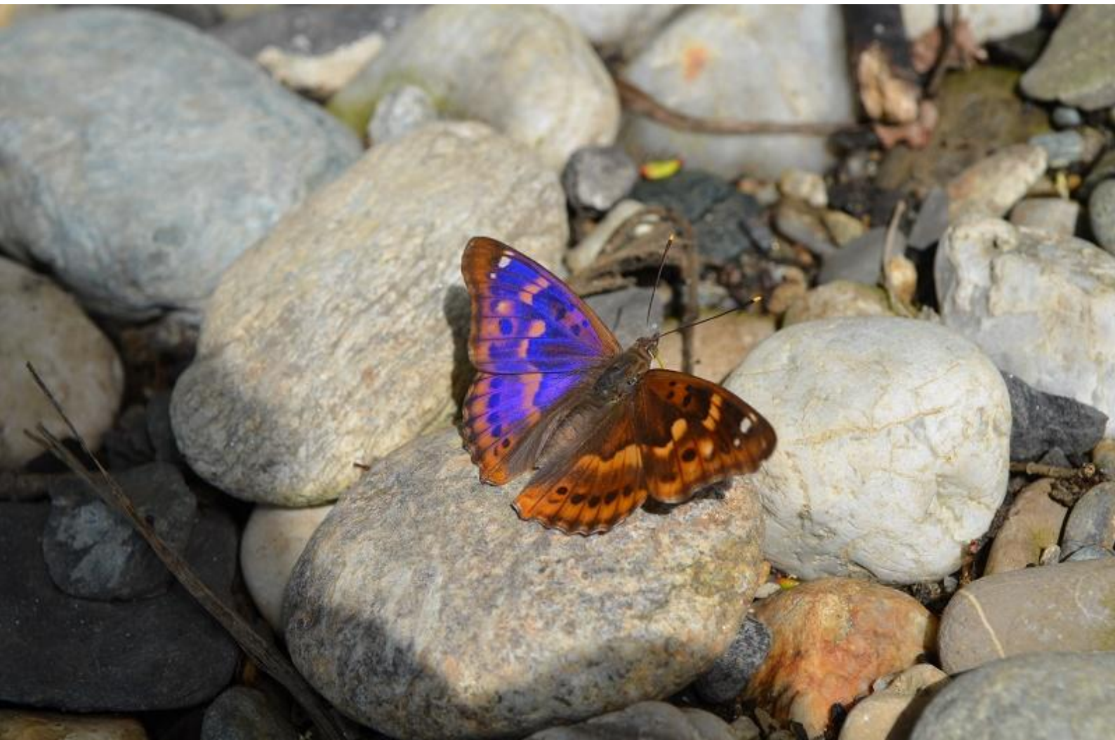
mali spreminjavček ( Apatura ilia )