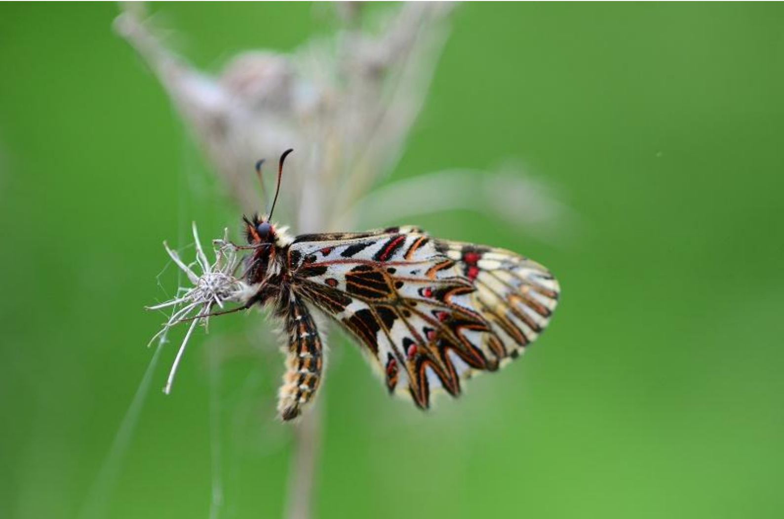
petelinček ( Zerynthia polyxena )