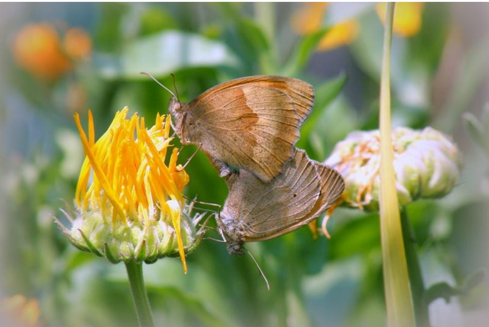
navadni lešnikar ( Maniola jurtina )