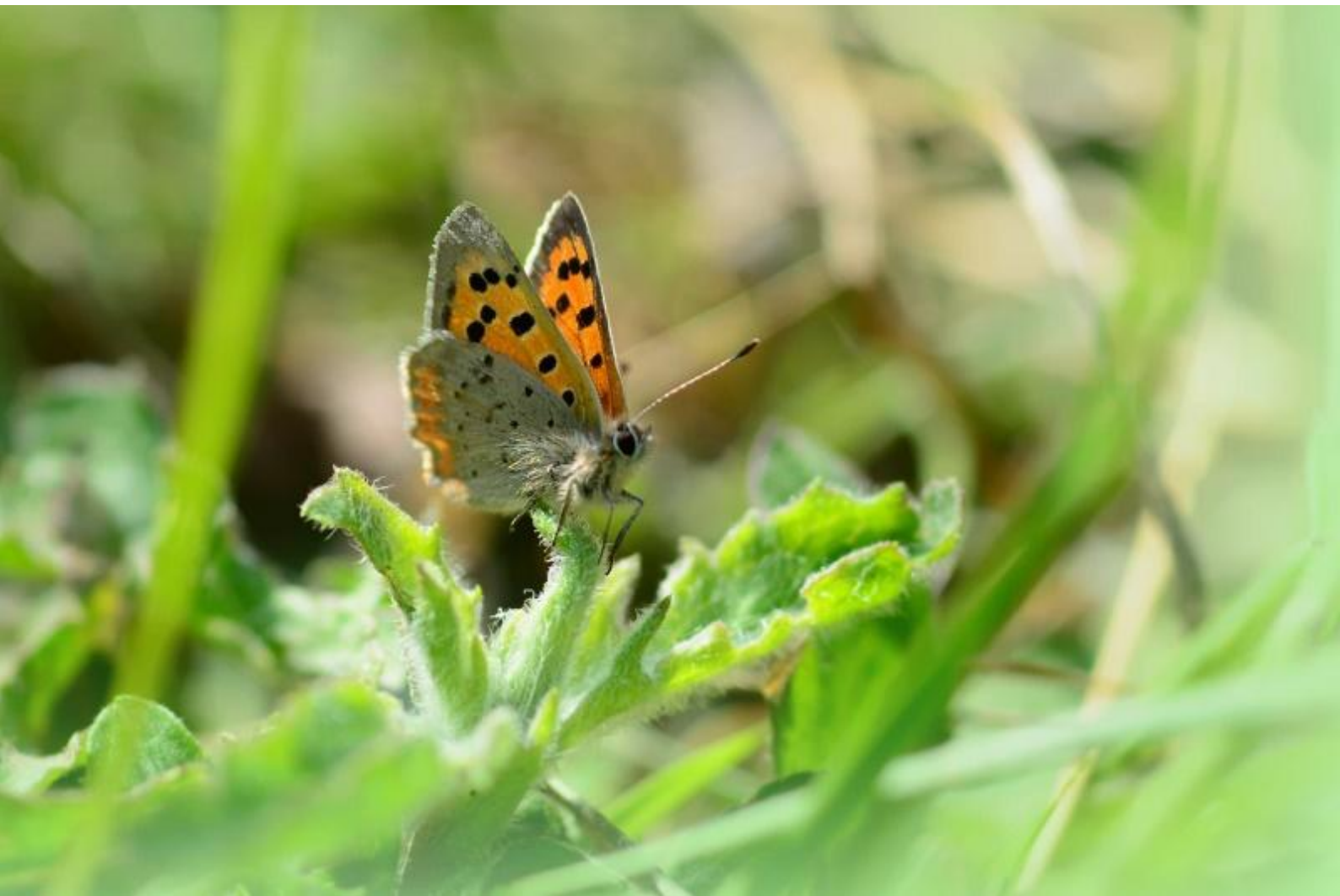
mali cekinček ( Lycaena phlaeas )