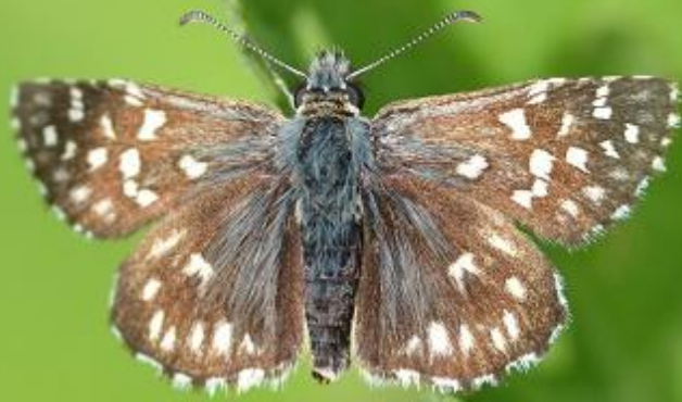
navadni slezovček ( Pyrgus malvae )