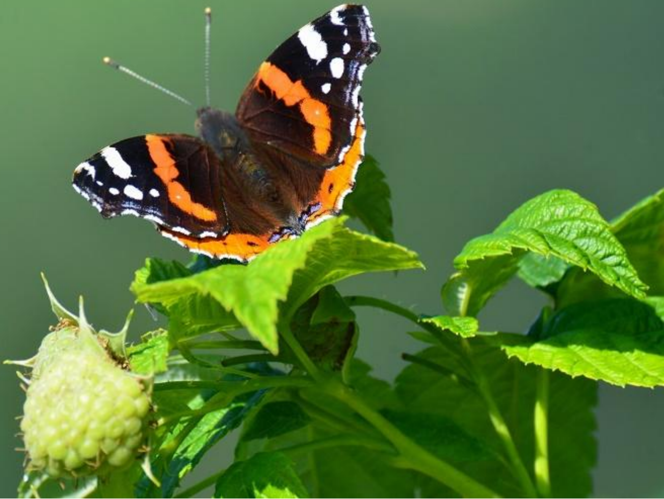
admiral ( Vanessa atalanta )