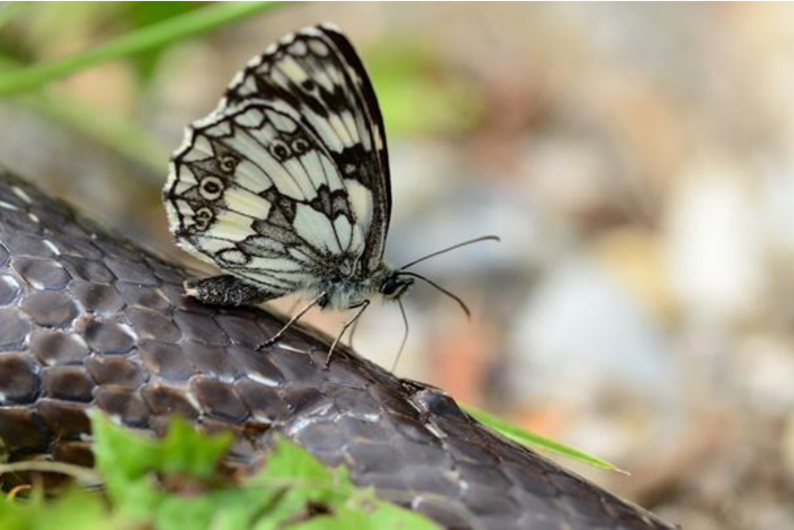
navadni lisar ( Melanargia galathea )