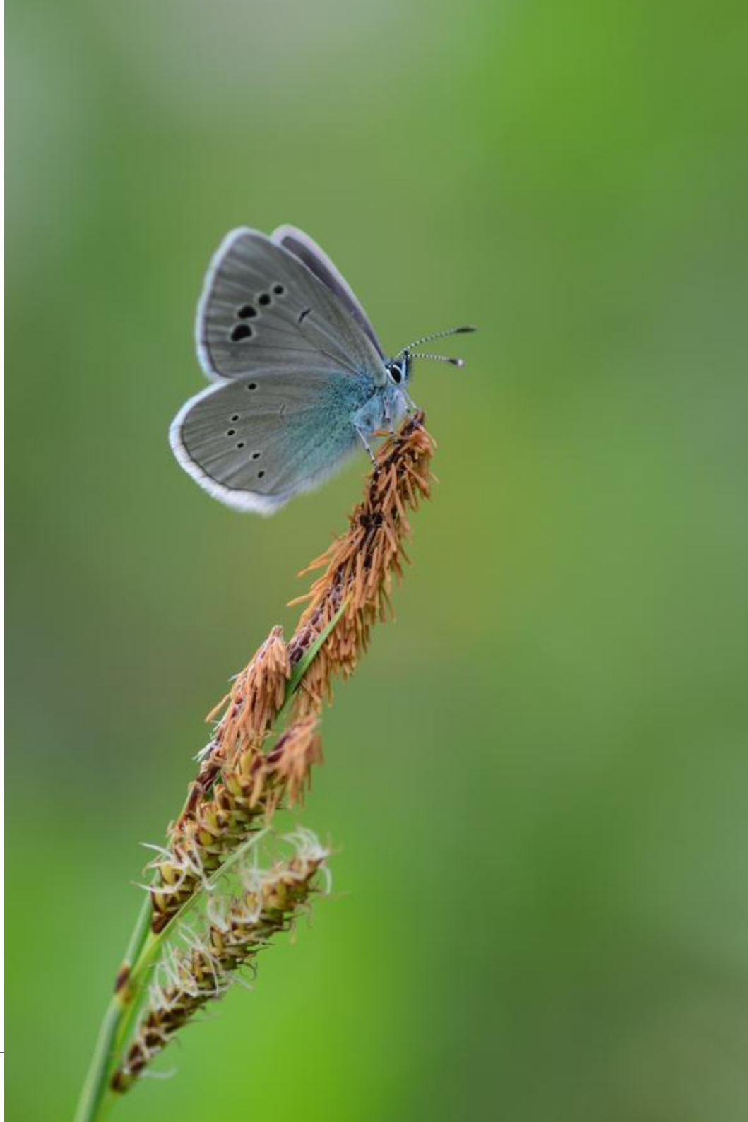
grabovčev iskrivček ( Glaucopsyche alexis )