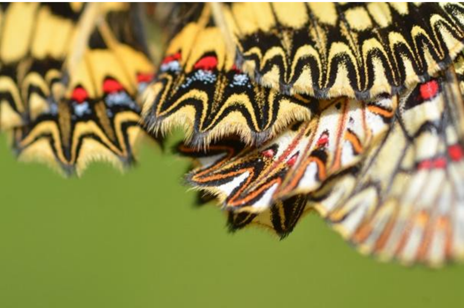
petelinček ( Zerynthia polyxena )