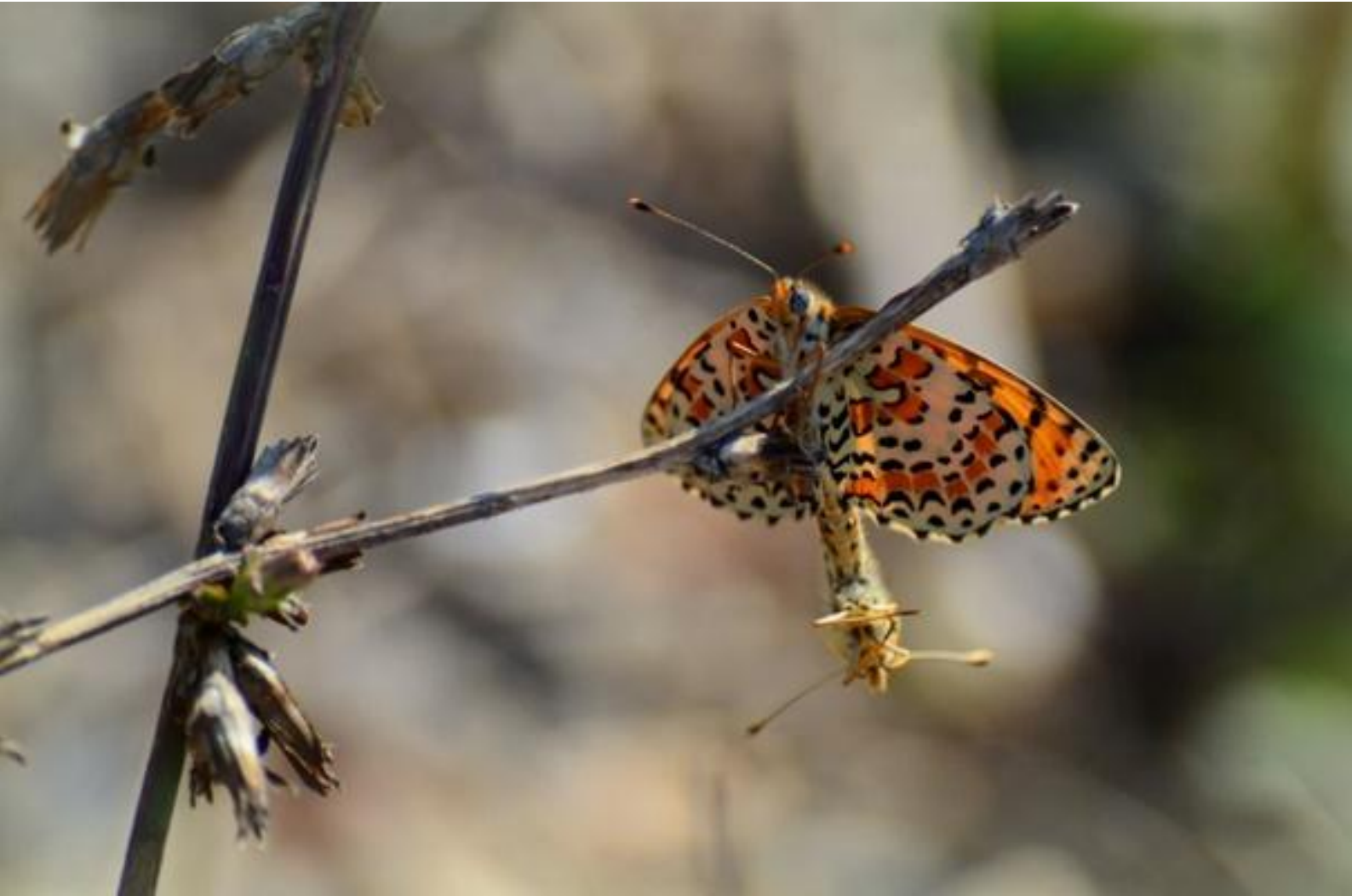
rdeči písanček ( Melitaea didyma )