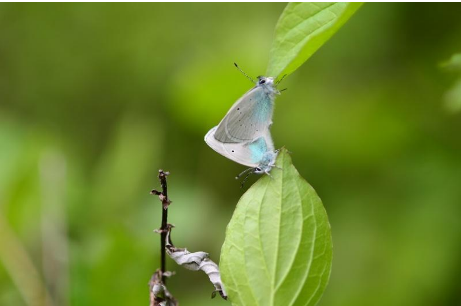
grabovčev iskrivček ( Glaucopsyche alexis )