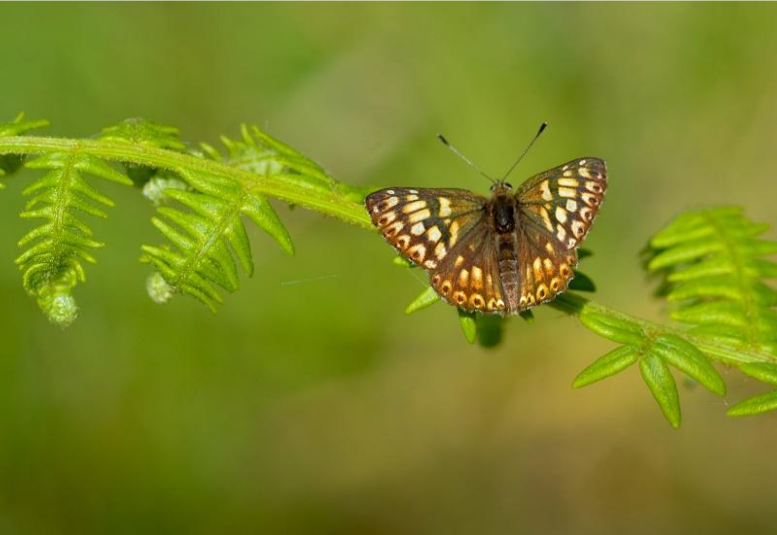
rjavi šekavček ( Hamearis lucina )