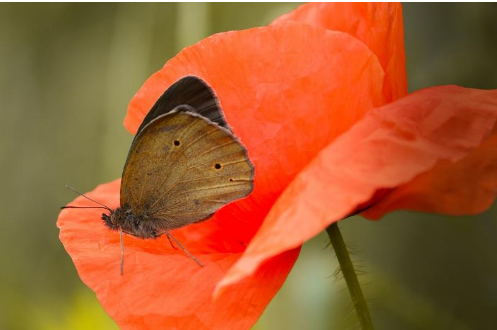
navadni lešnikar ( Maniola jurtina )