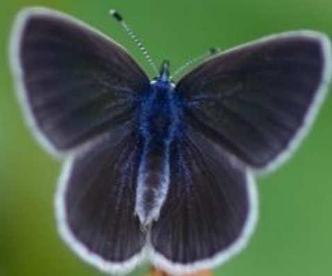
modri grašičar ( Cyaniris semiargus )