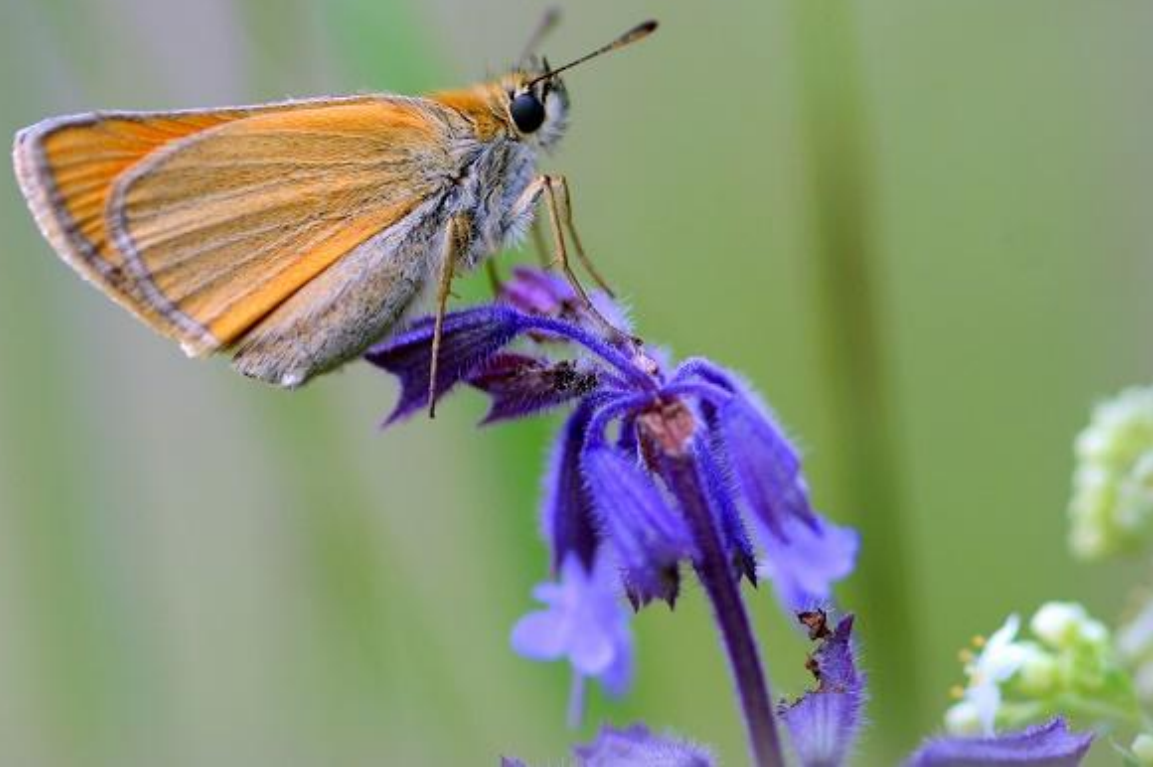
kratkočrti debeloglavec ( Thymelicus lineola )