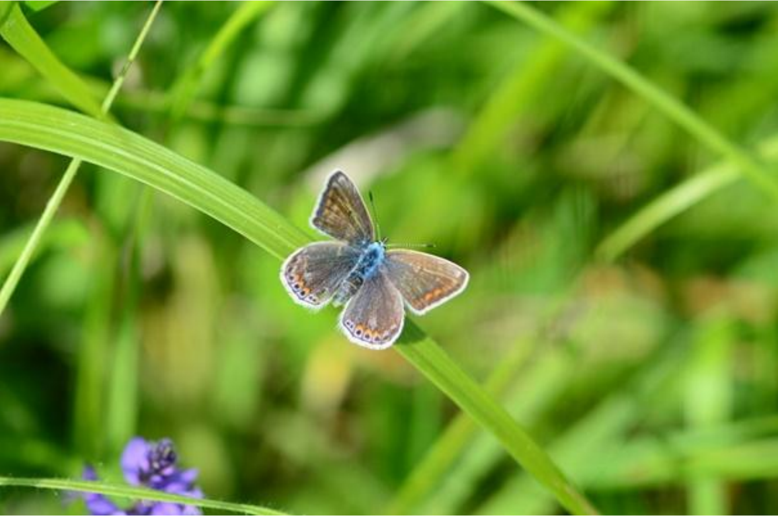
navadni modrin ( Polyommatus icarus )