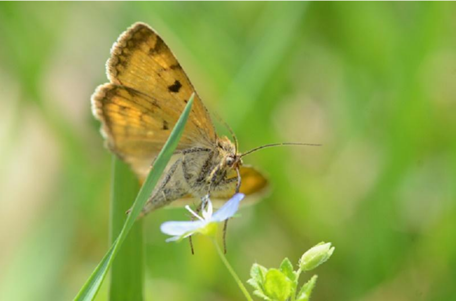
deteljna sovka ( Euclidia glyphica )