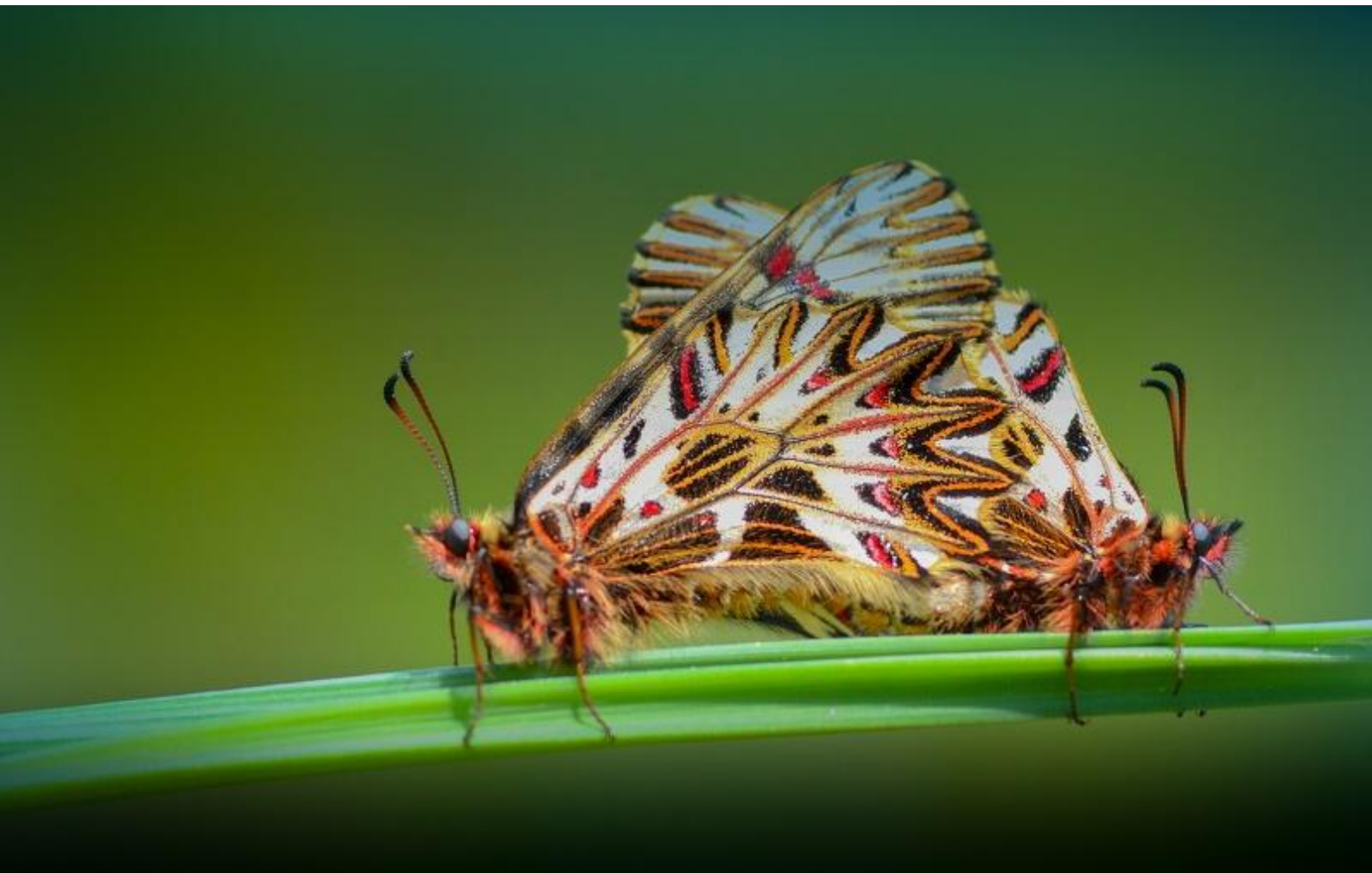
petelinček ( Zerynthia polyxena )