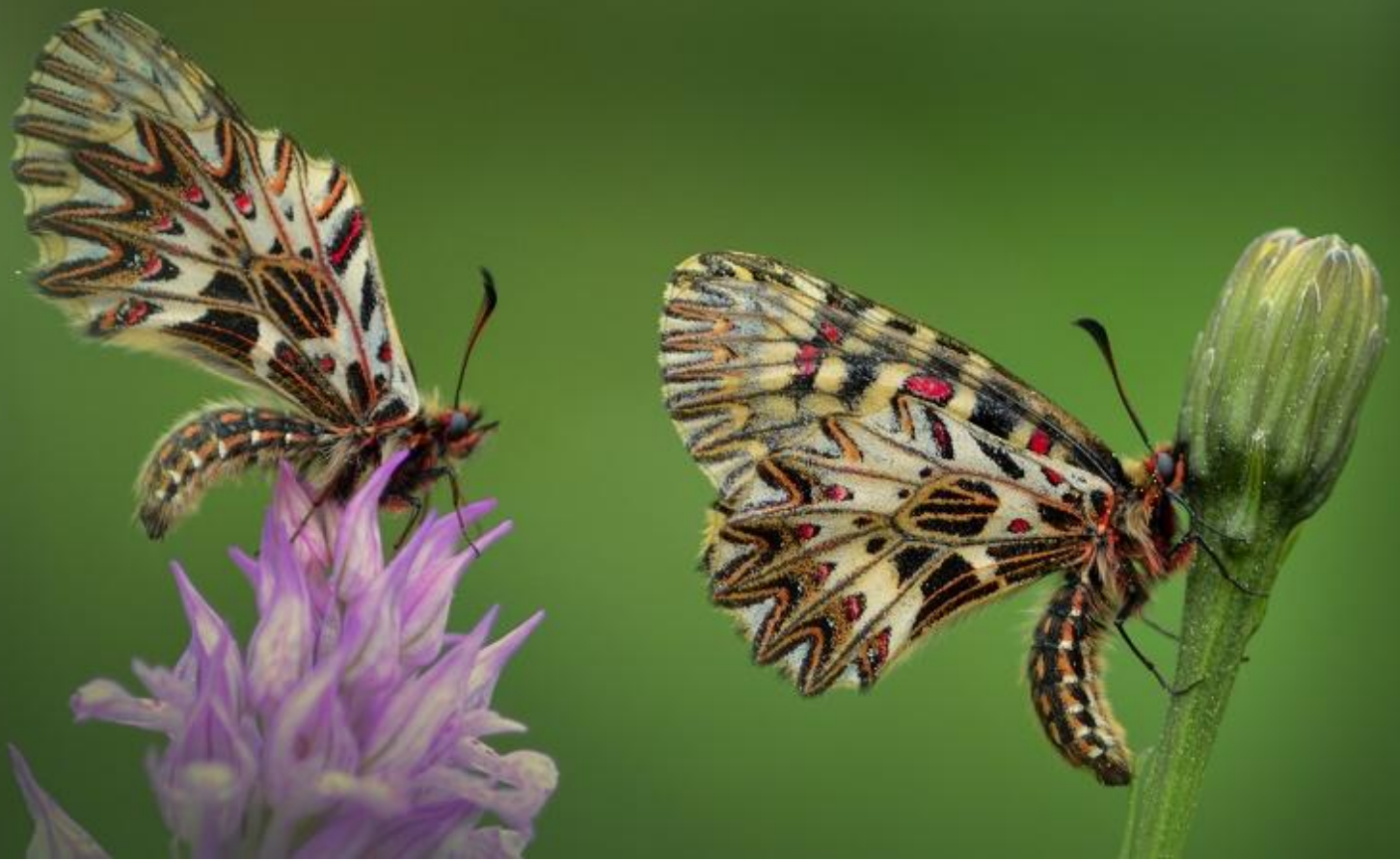
petelinček ( Zerynthia polyxena )