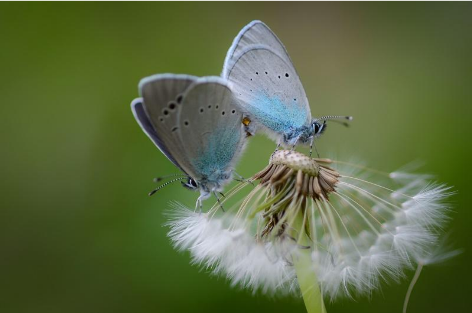
grabovčev iskrivček ( Glaucopsyche alexis )