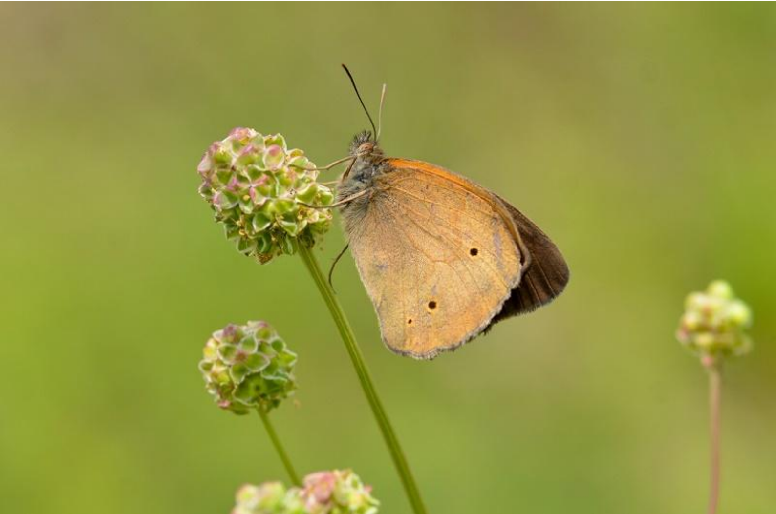
navadni lešnikar ( Maniola jurtina )