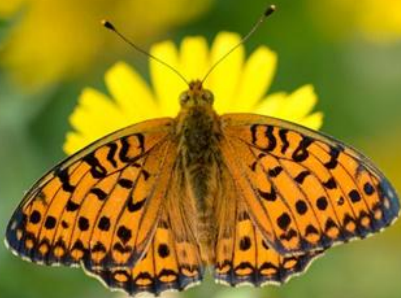
bleščeči bisernik ( Argynnis aglaja )