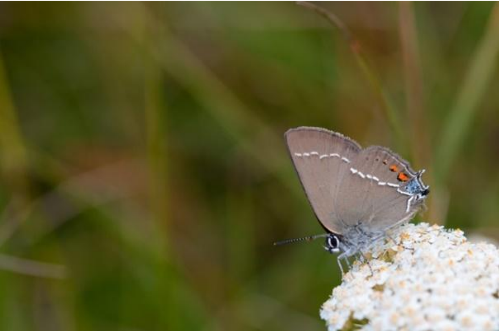
trnov repkar ( Satyrium spini )