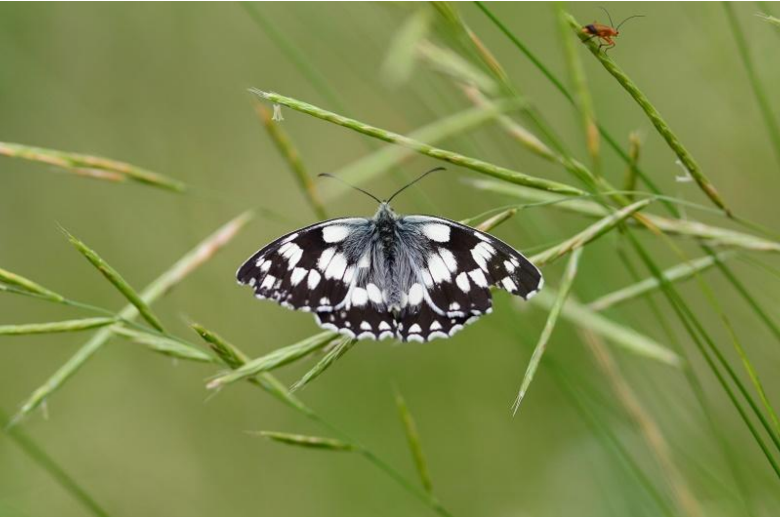
navadni lisar ( Melanargia galathea )