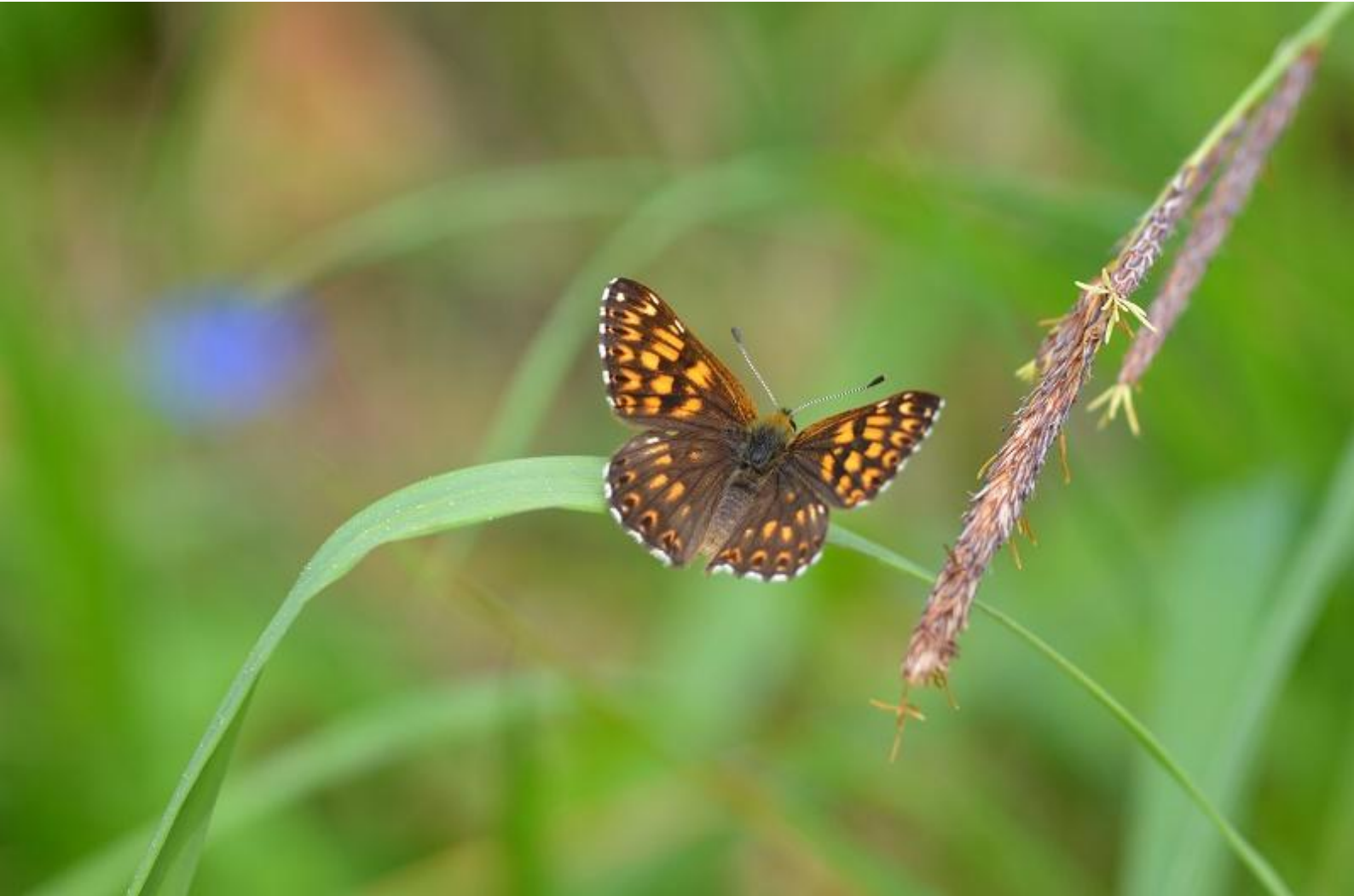
rjavi šekavček ( Hamearis lucina )