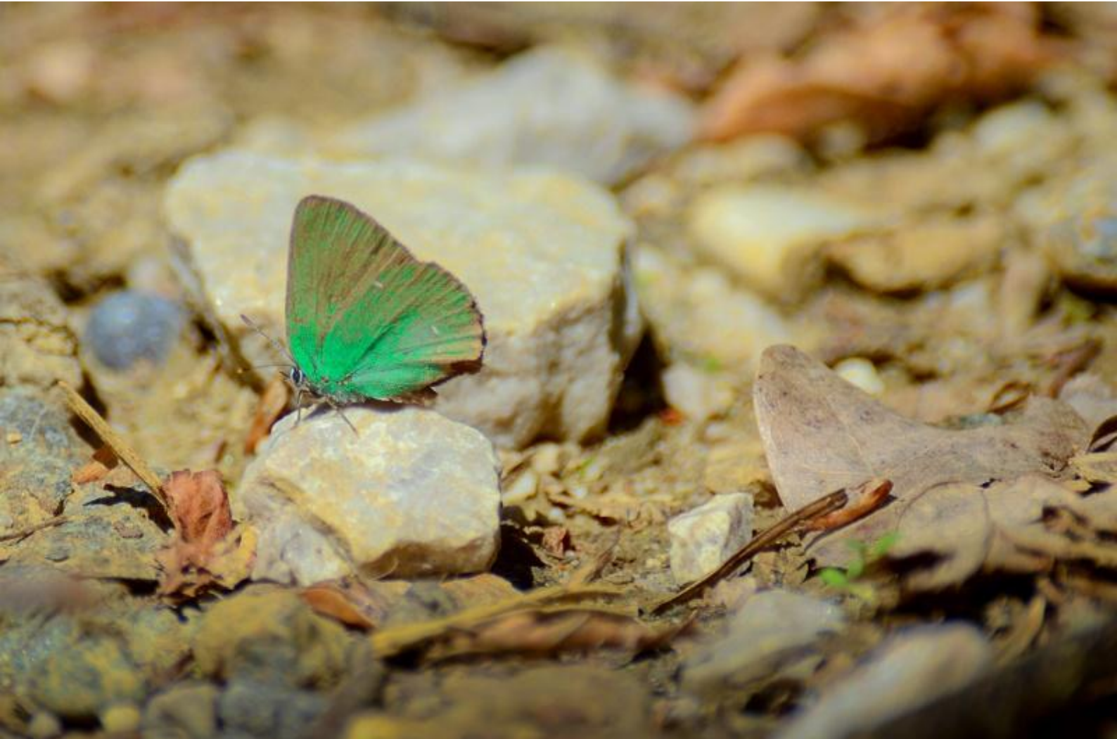
zeleni robidar ( Callophrys rubi )