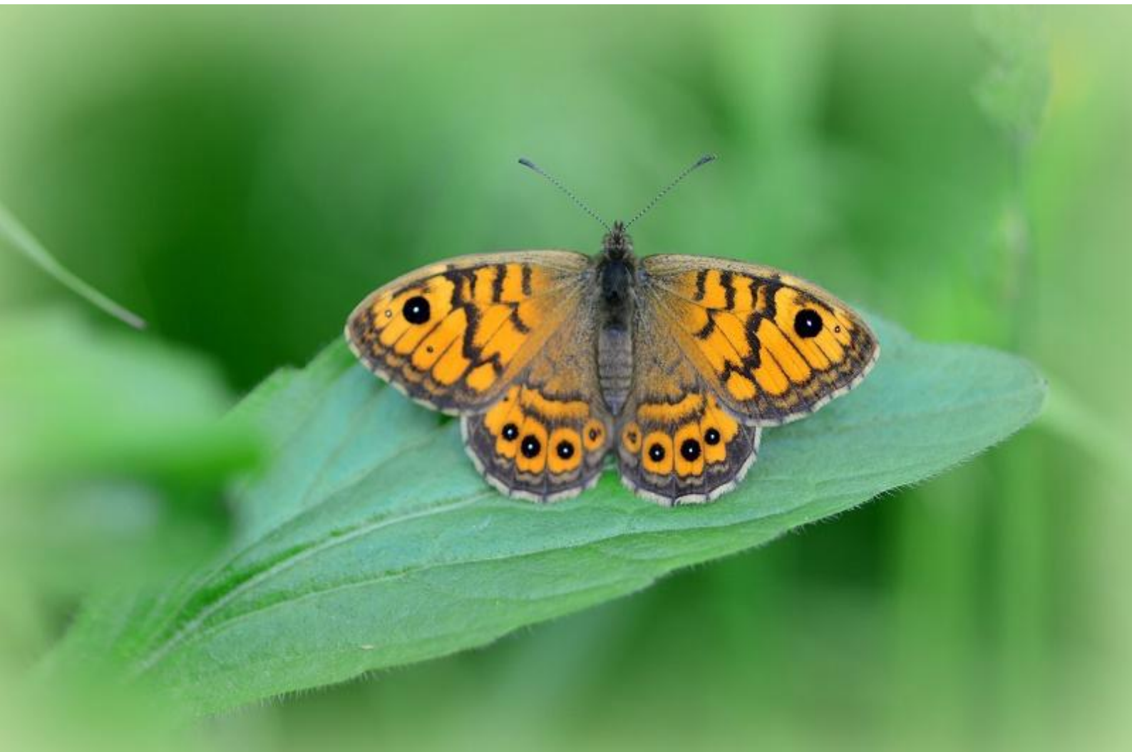
okrasti skalnik ( Lasiommata megera )