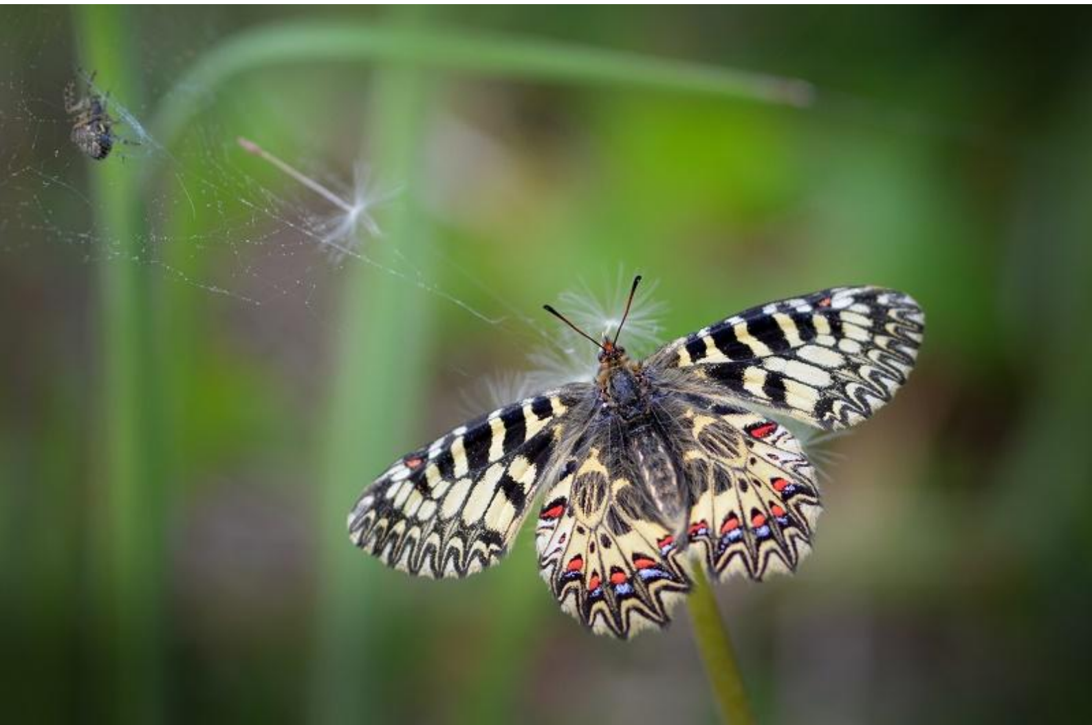
petelinček ( Zerynthia polyxena )