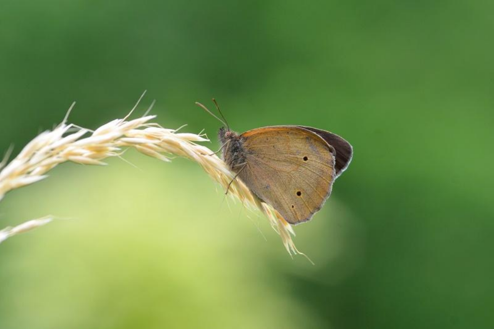
navadni lešnikar ( Maniola jurtina )