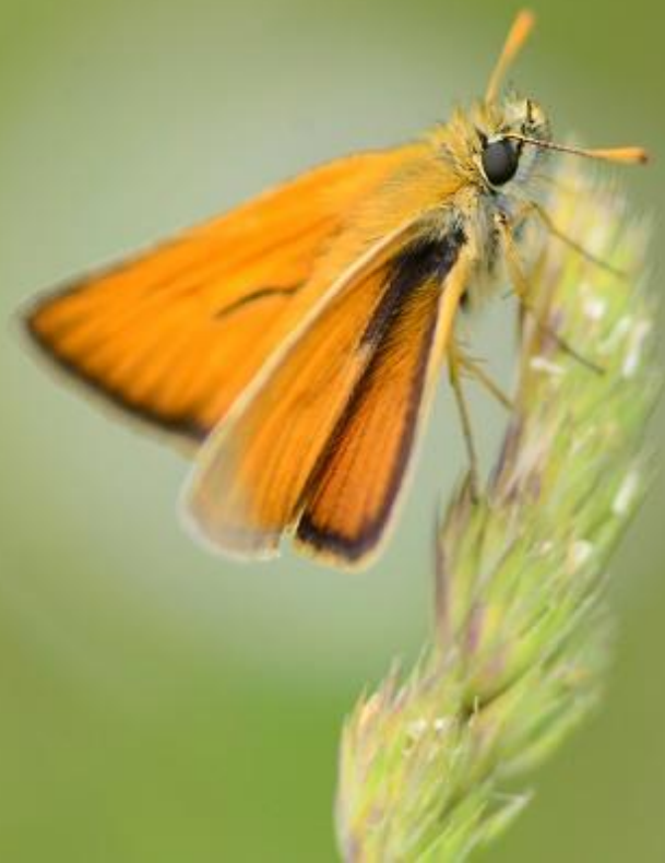
kratkočrti debeloglaviček ( Thymelicus lineola )