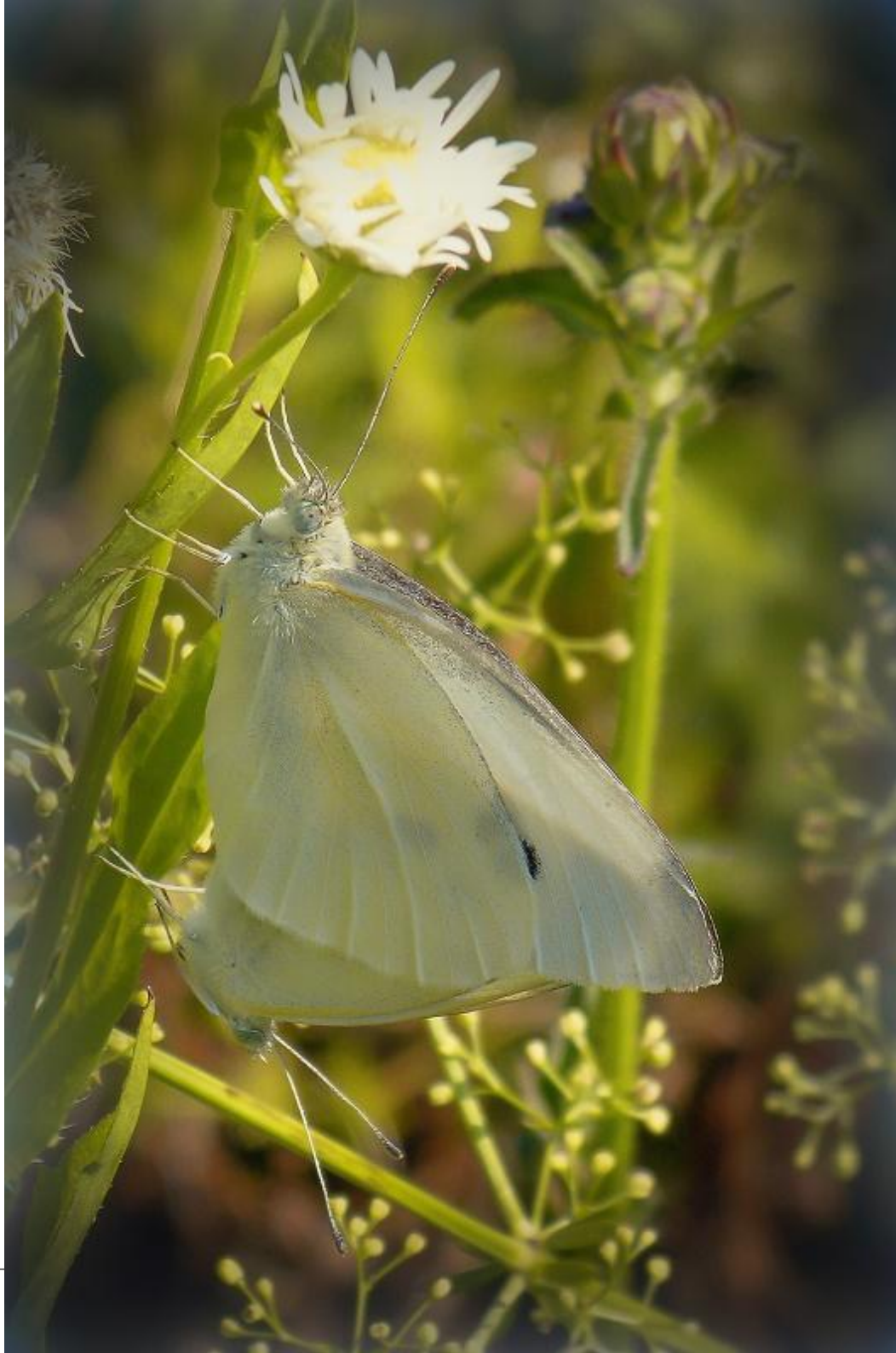
repin belin ( Pieris rapae )