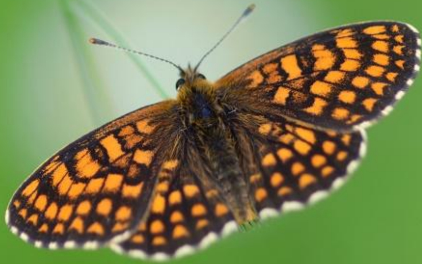
navadni pisanček ( Melitaea athalia )