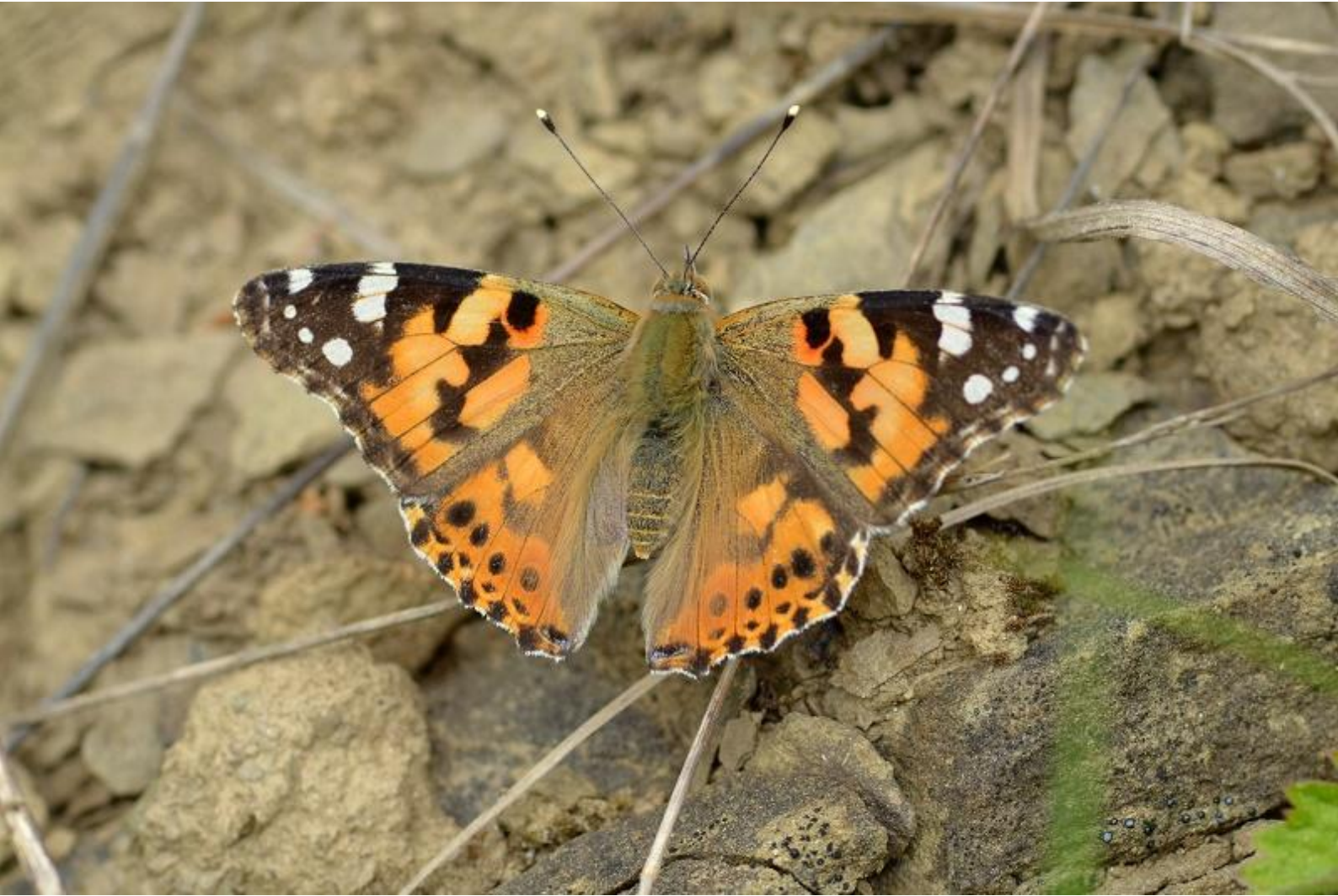
osatnik ( Vanessa cardui )