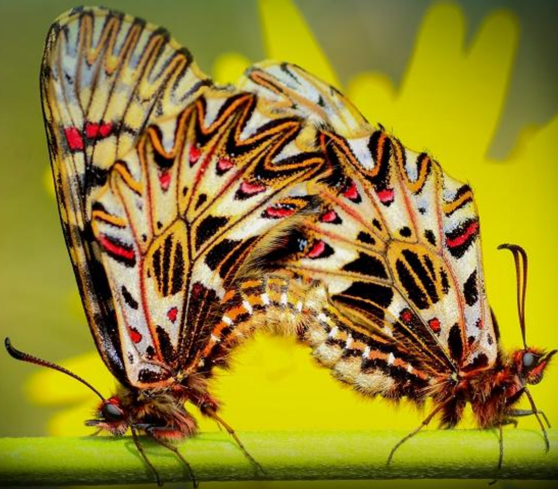
petelinček ( Zerynthia polyxena )