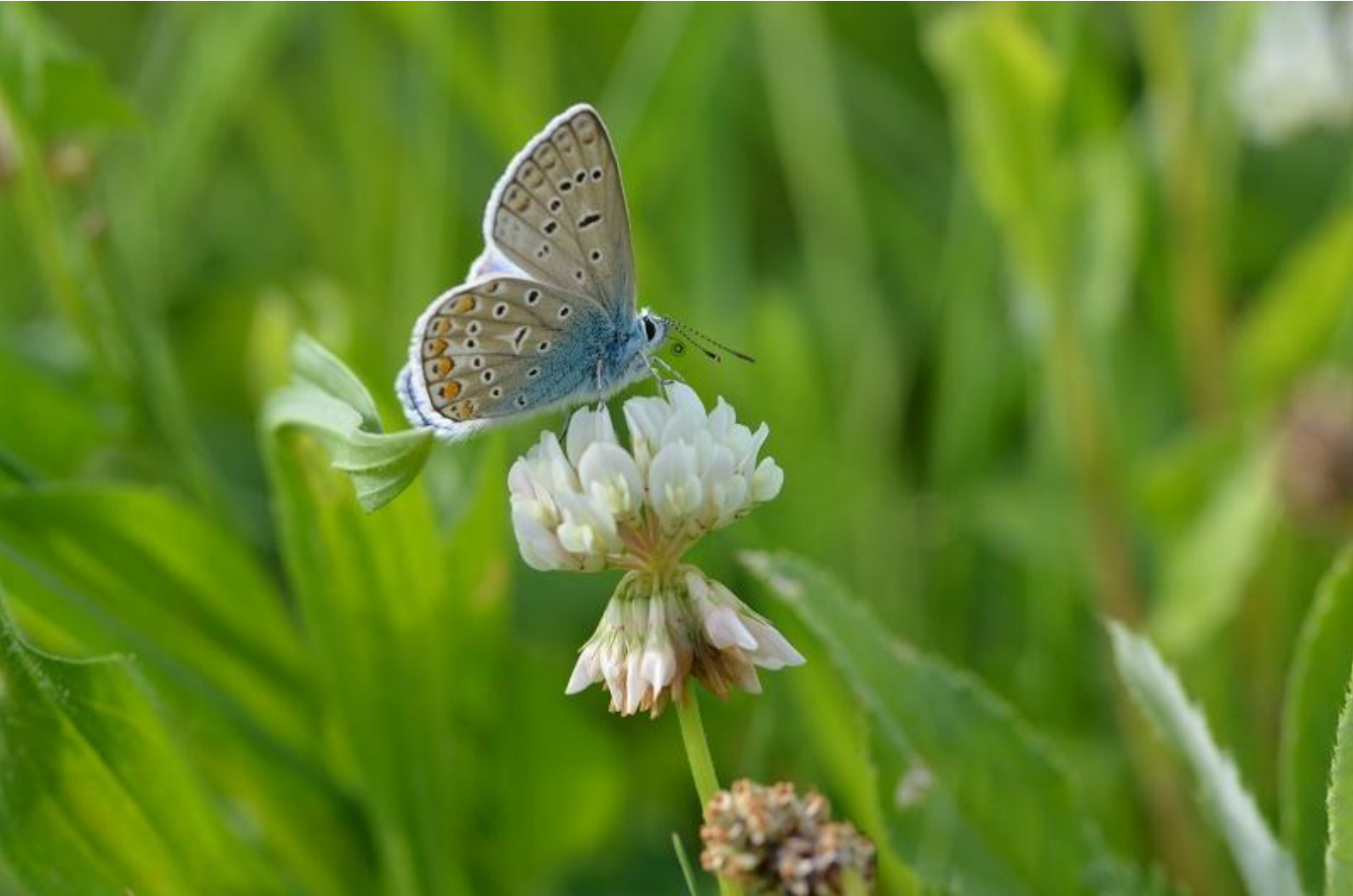
navadni modrin ( Polyommatus icarus )