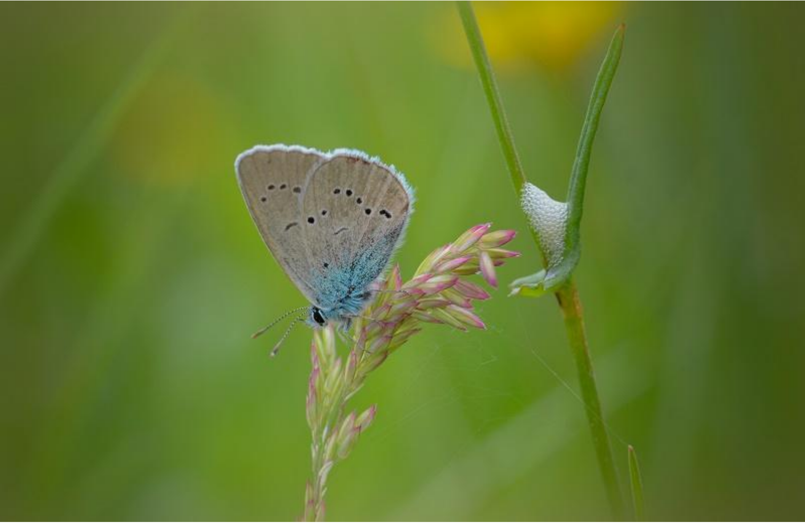
modri grašičar ( Cyaniris semiargus )