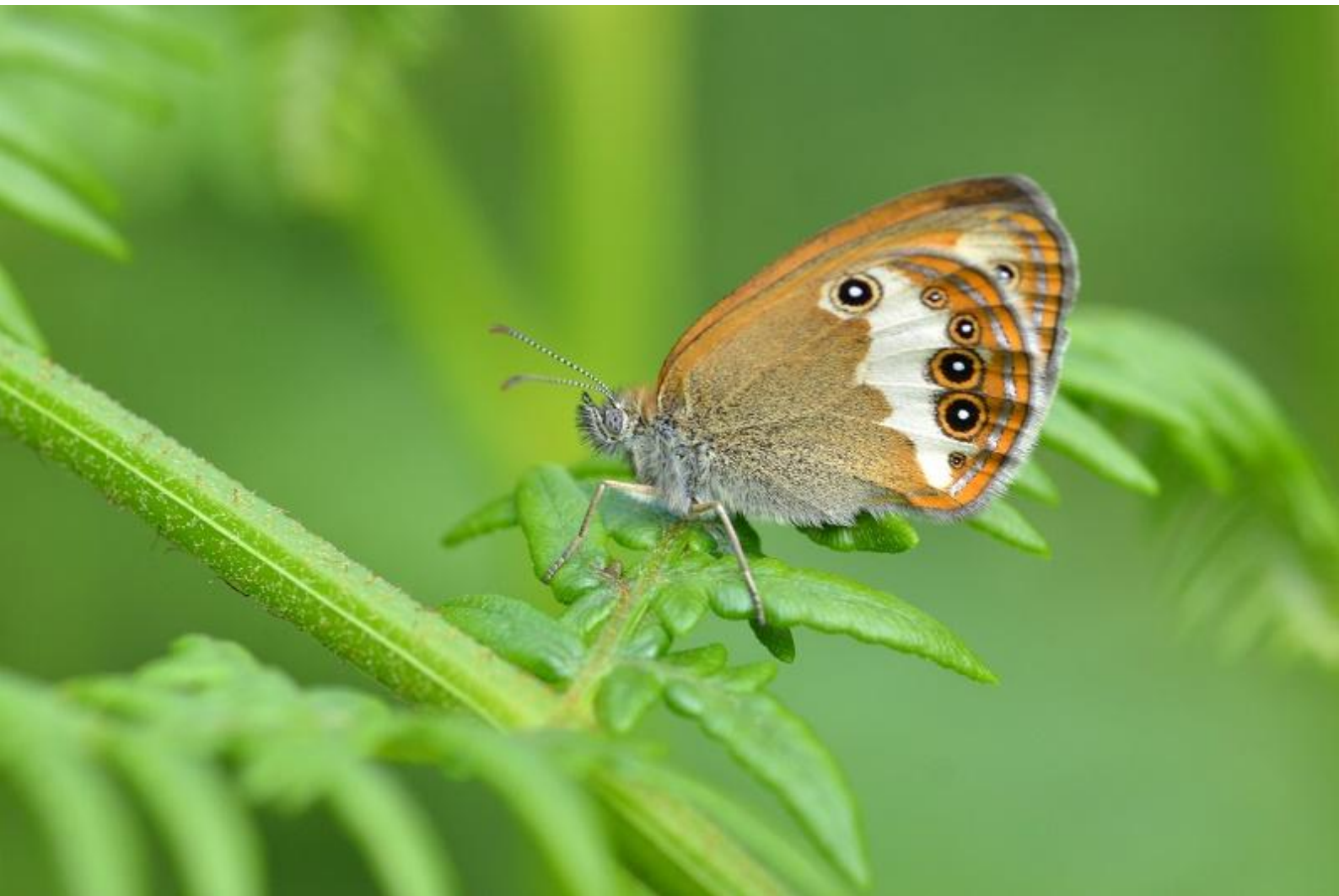
grmišni okarček ( Coenonympha arcania )