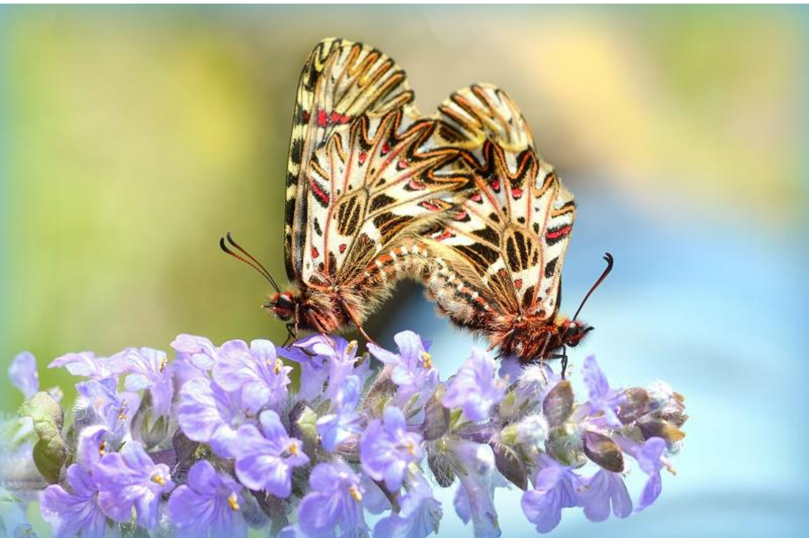
petelinček ( Zerynthia polyxena )