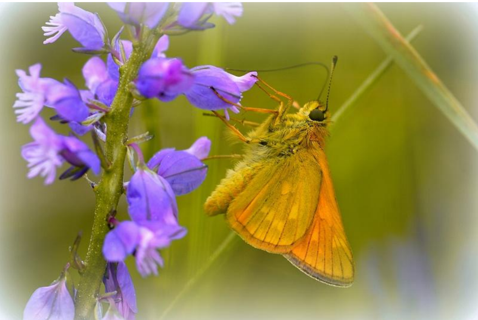
rjasti vibravček ( Ochlodes sylvanus )