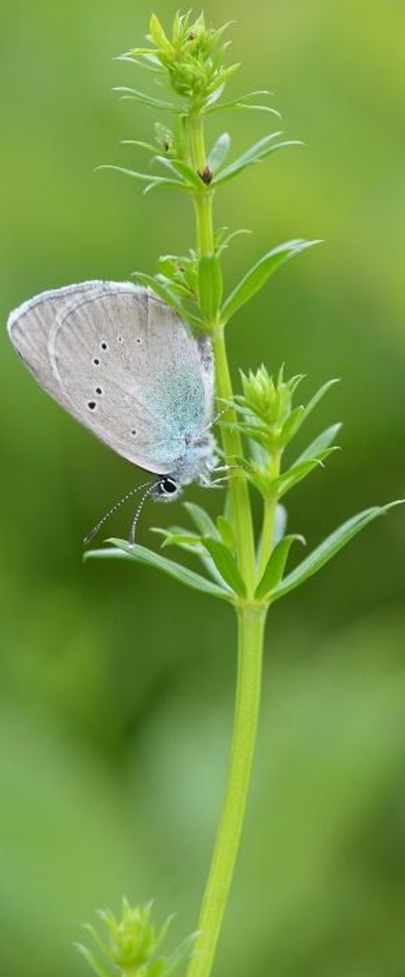
grabovčev iskrivček ( Glaucopsyche alexis )