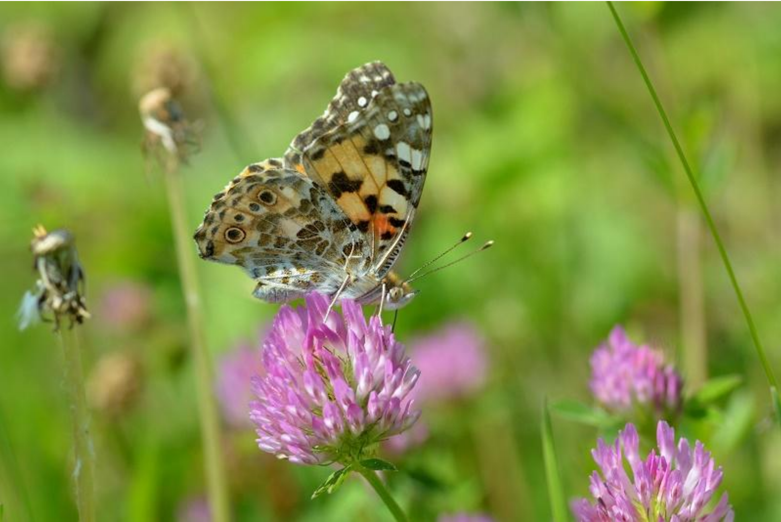
osatnik ( Vanessa cardui )