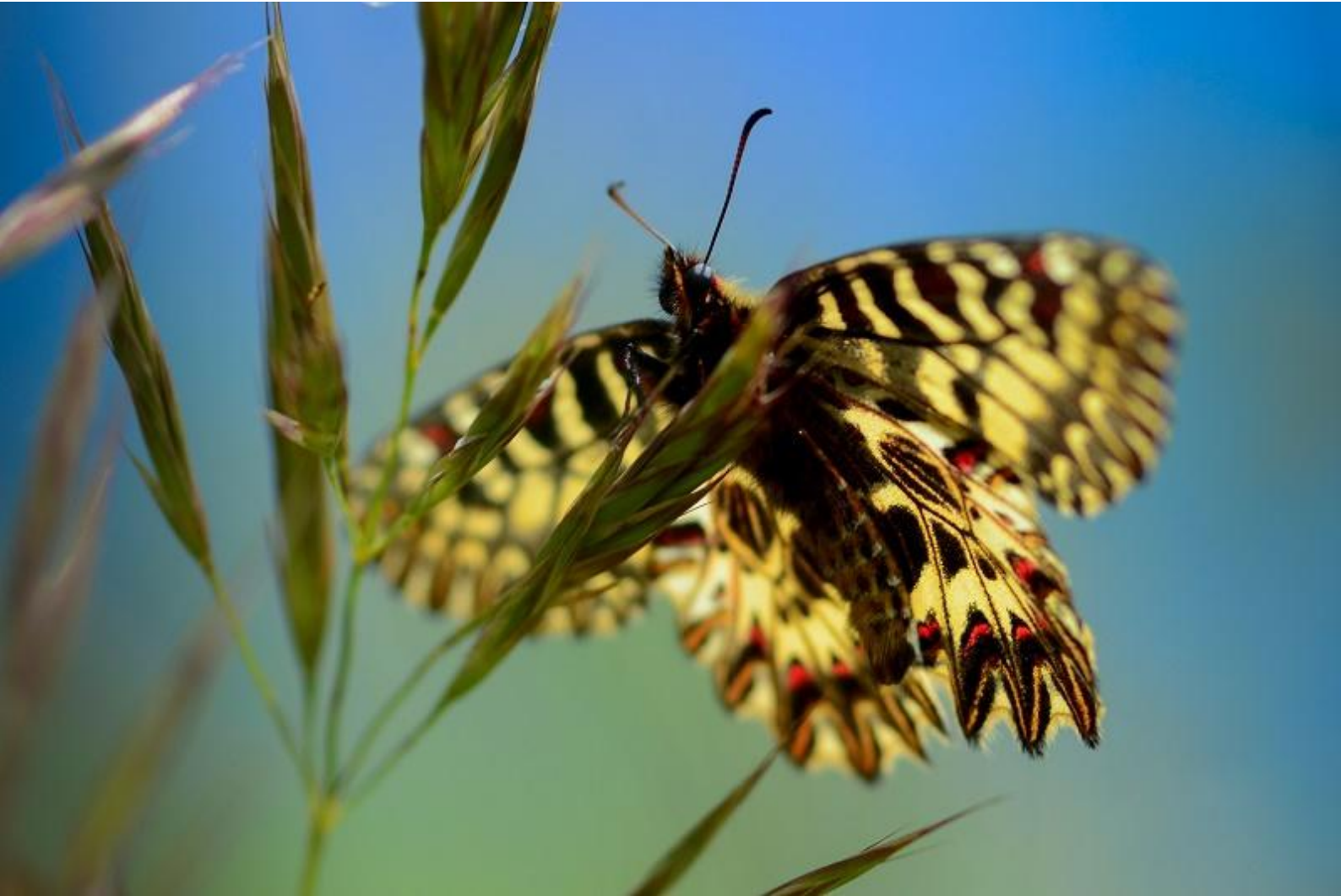
petelinček ( Zerynthia polyxena )