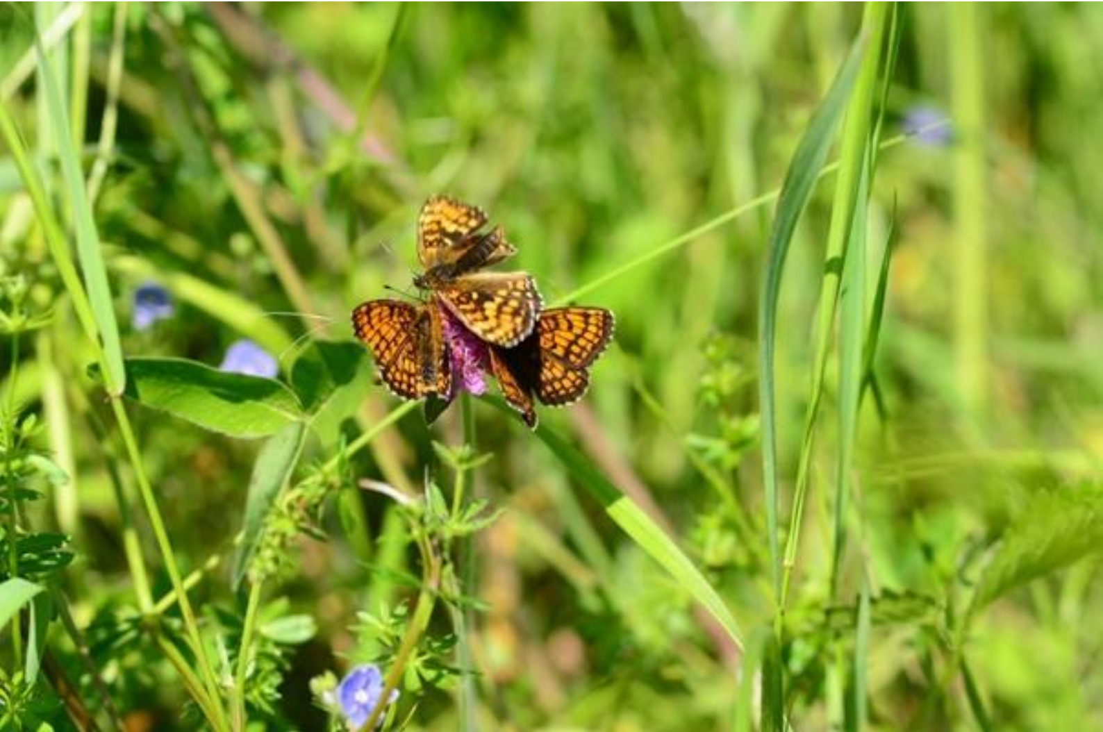
navadni pisanček ( Melitaea athalia )