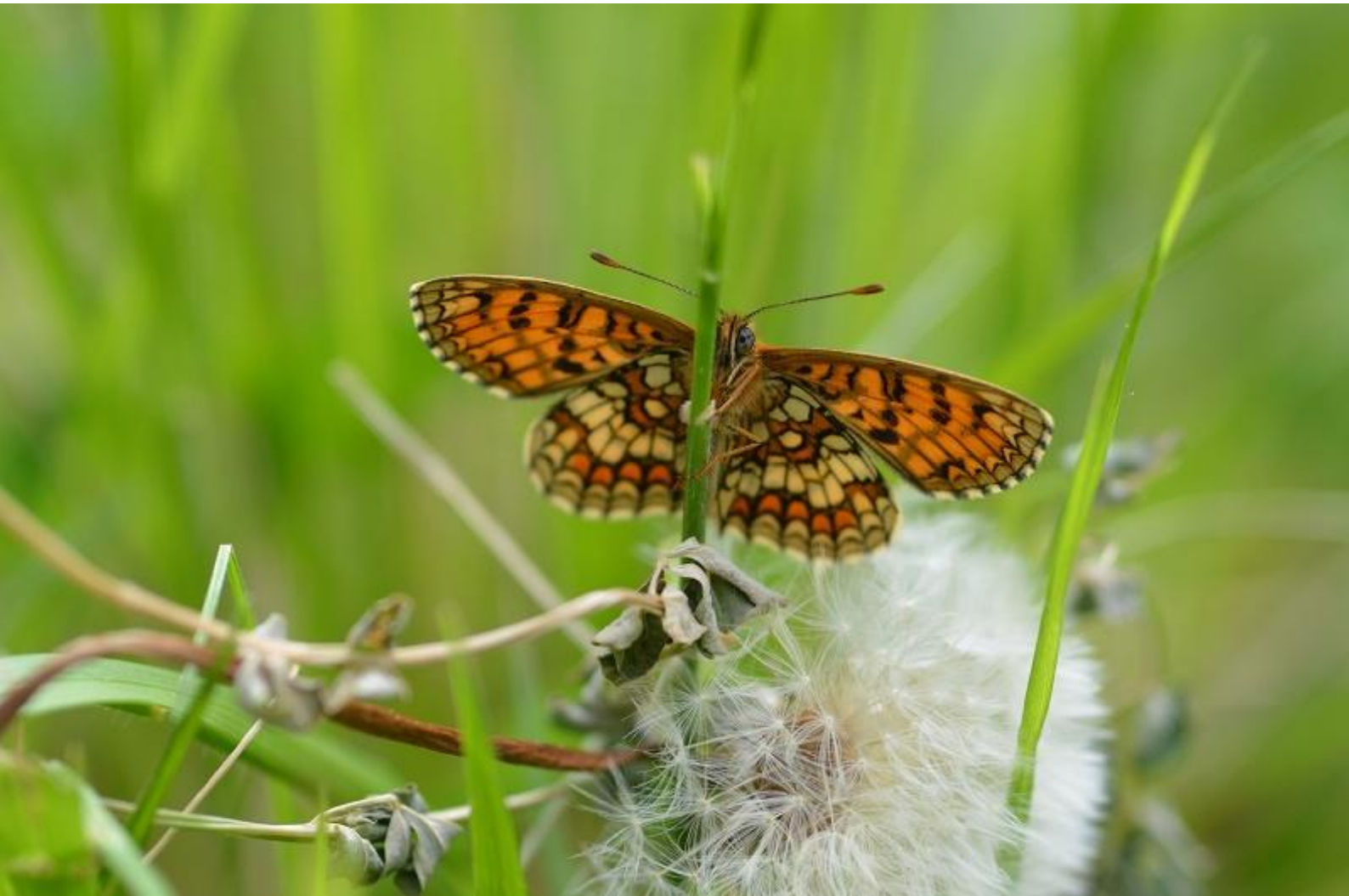
navadni pisanček ( Melitaea athalia )