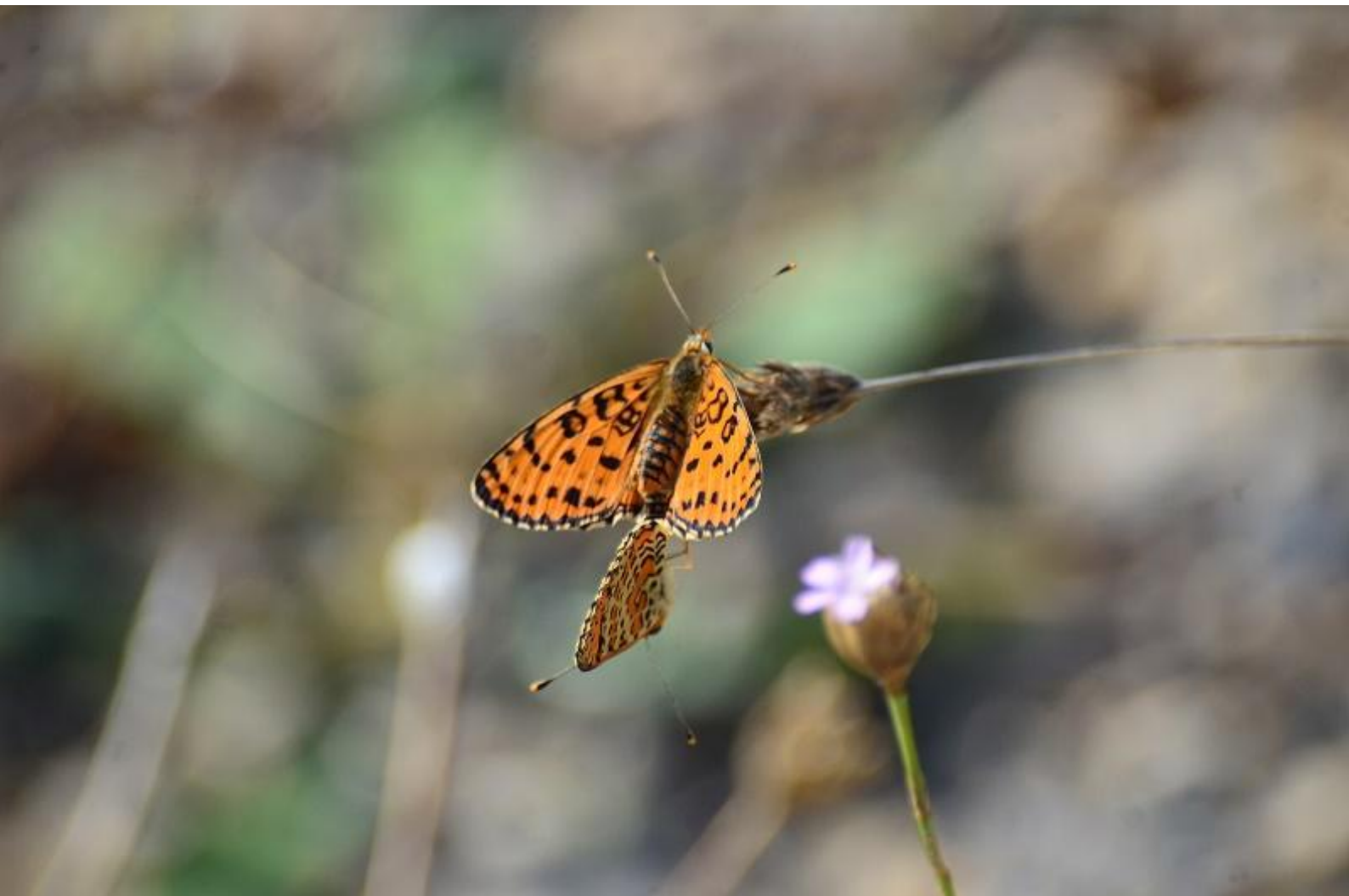
rdeči písanček ( Melitaea didyma )