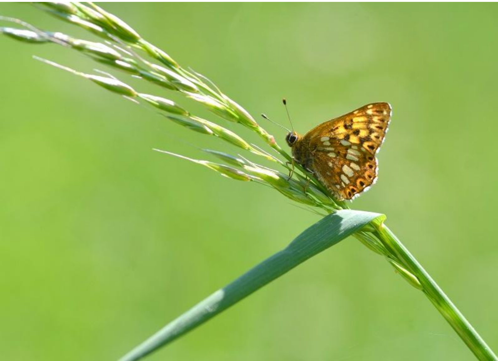
rjavi šekavček ( Hamearis lucina )