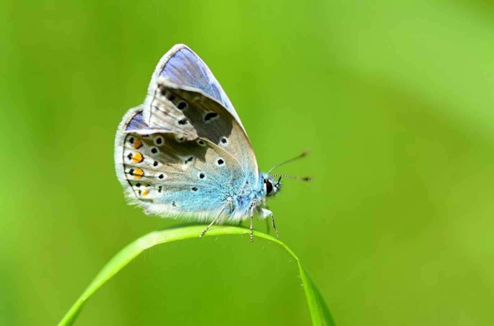
navadni modrin ( Polyommatus icarus )