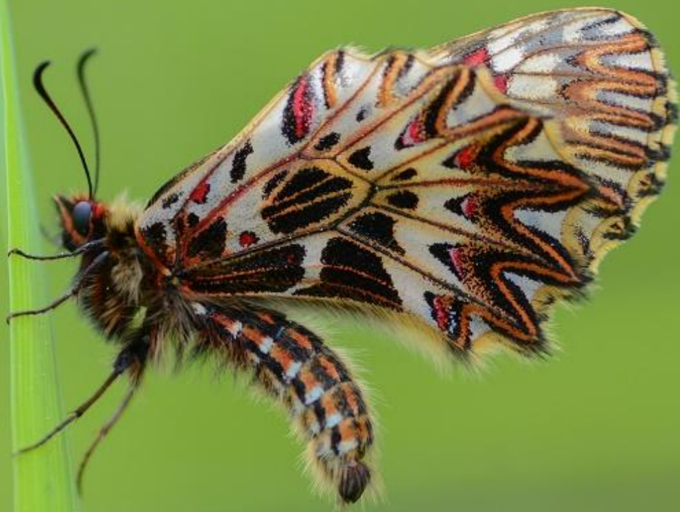
petelinček ( Zerynthia polyxena )