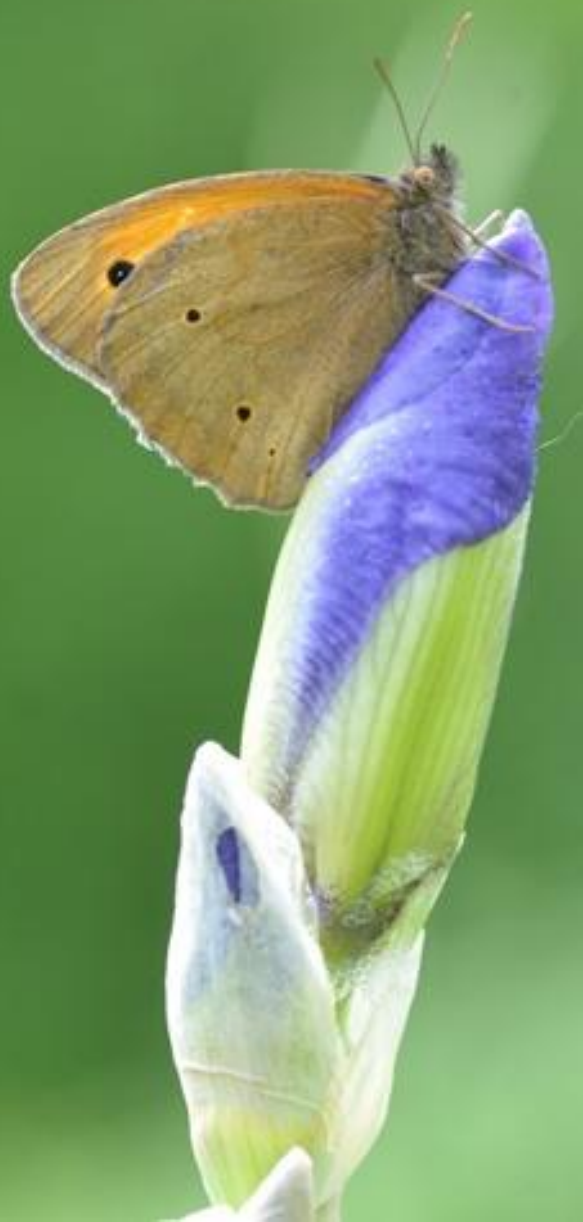
navadni lešnikar ( Maniola jurtina )