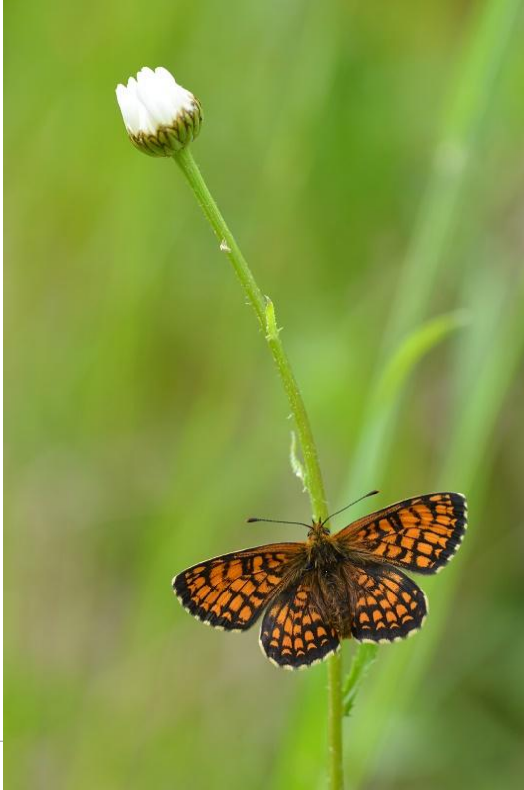
navadni pisanček ( Melitaea athalia )