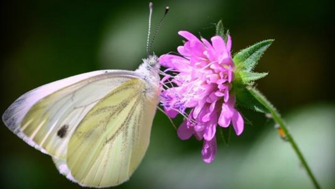
repičin belin ( Pieris napi )