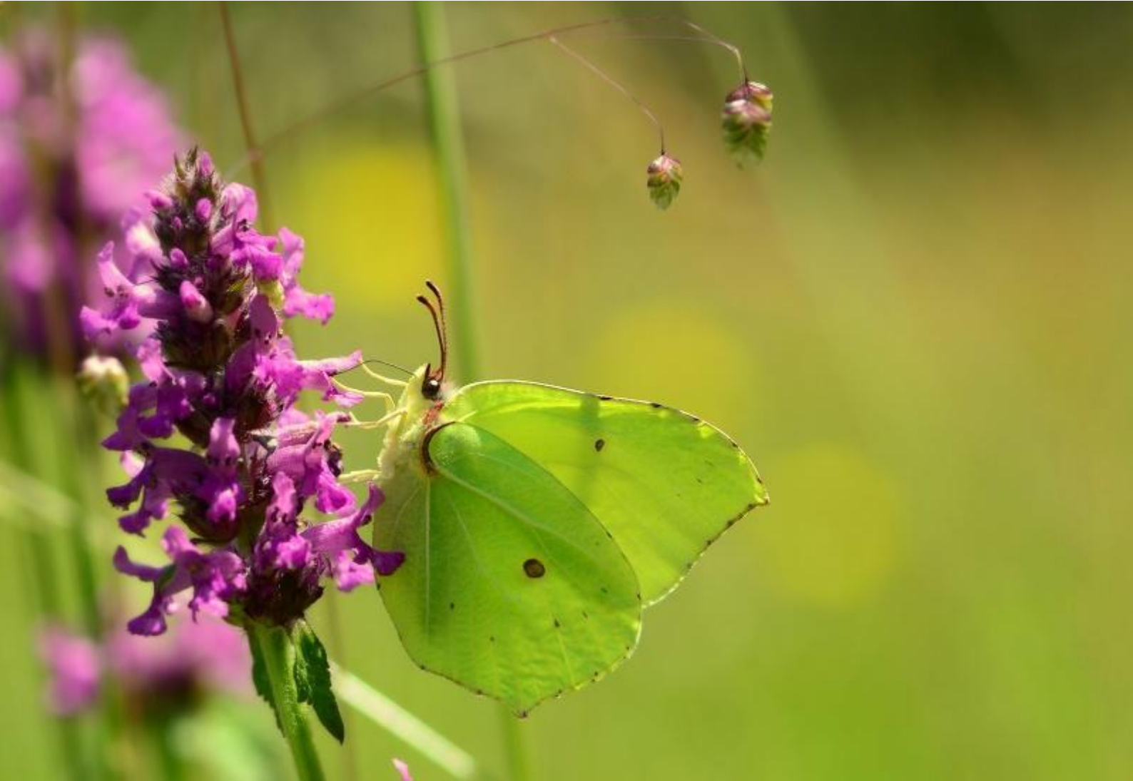
citronček ( Gonepteryx rhamni )