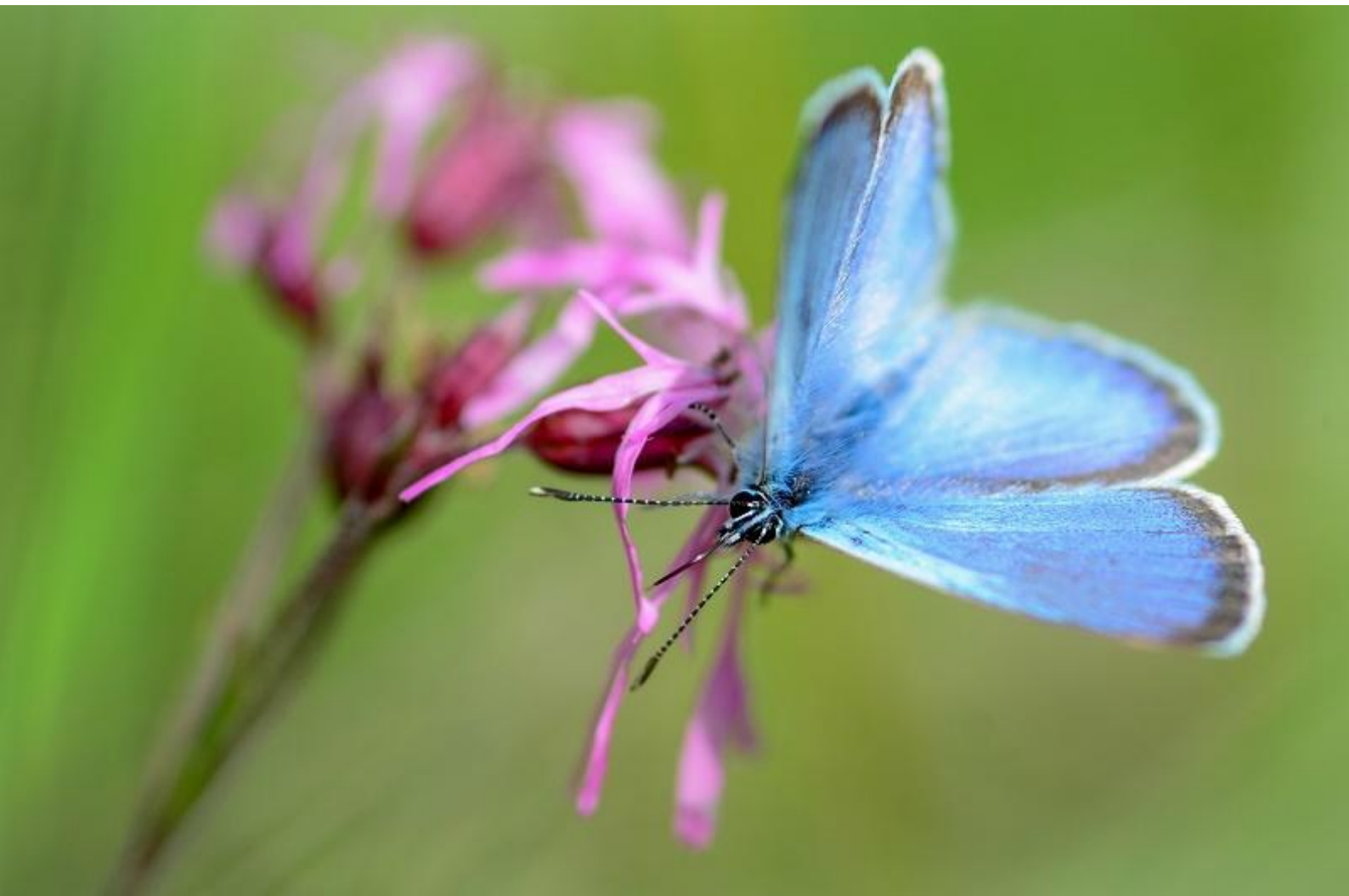
grabovčev iskrivček ( Glaucopsyche alexis )