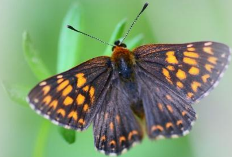
rjavi šekavček ( Hamearis lucina )