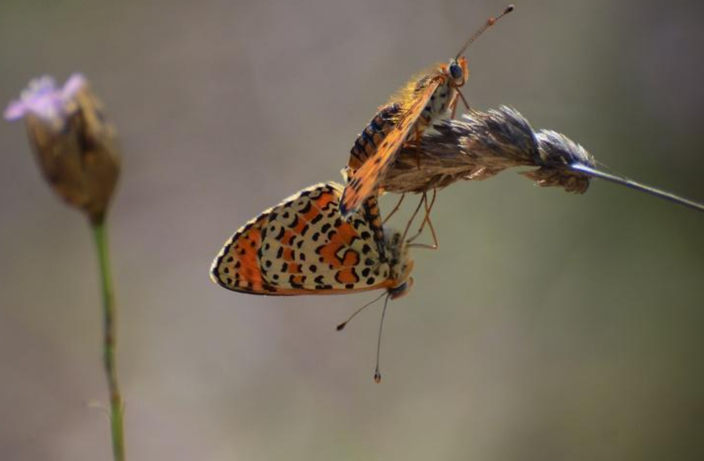
rdeči písanček ( Melitaea didyma )