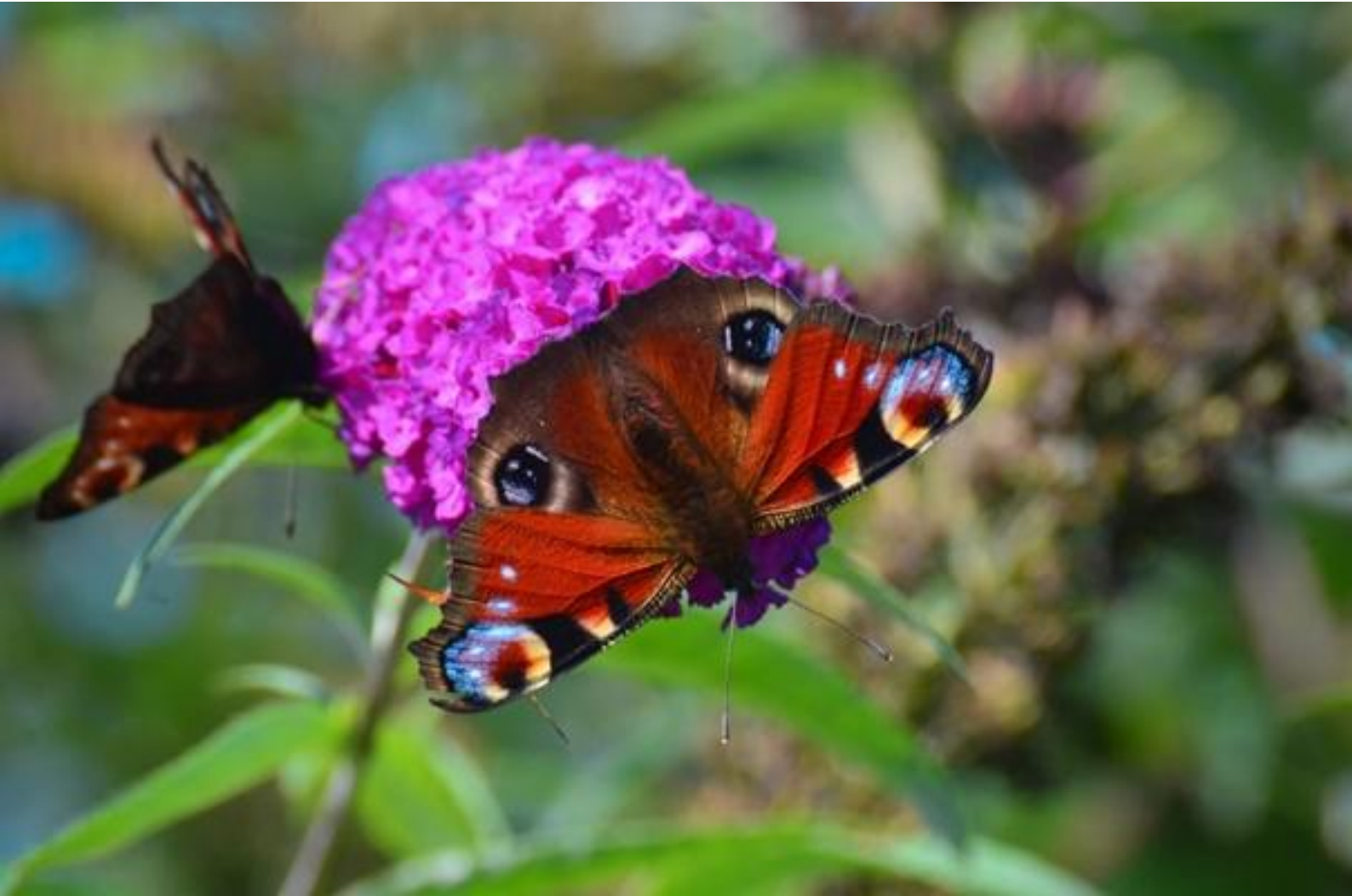
dnevni pavlinček ( Aglais io )