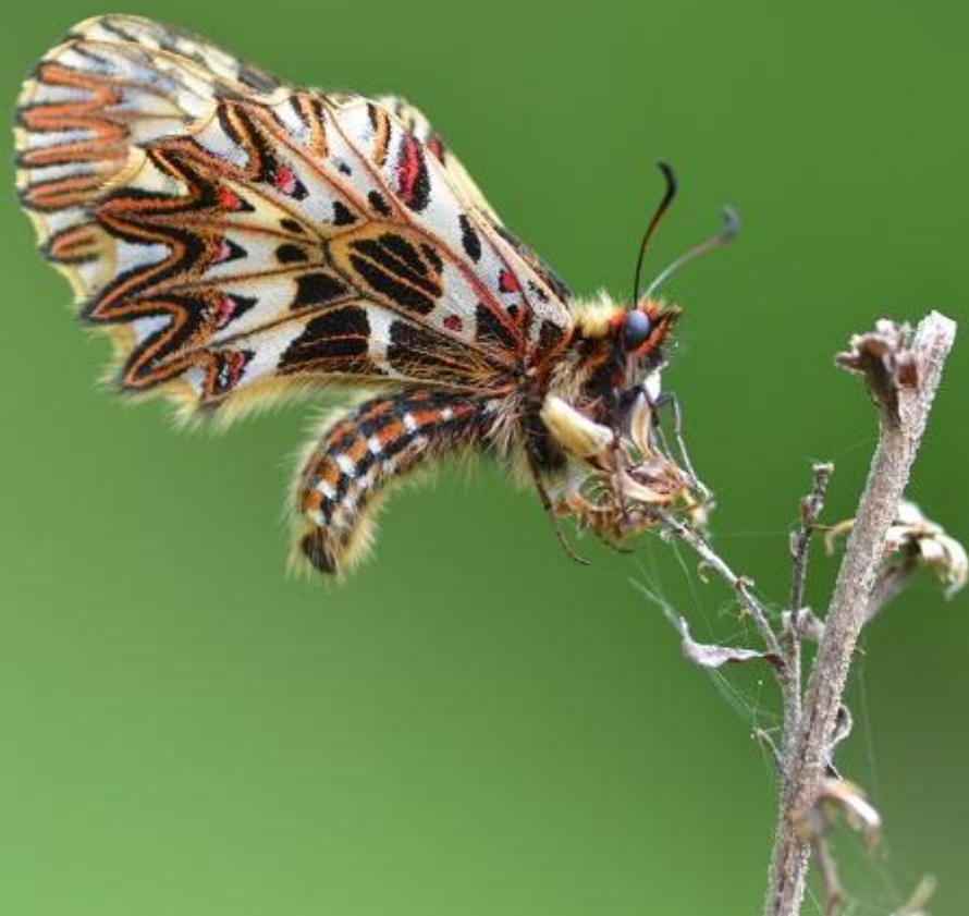
petelinček ( Zerynthia polyxena )