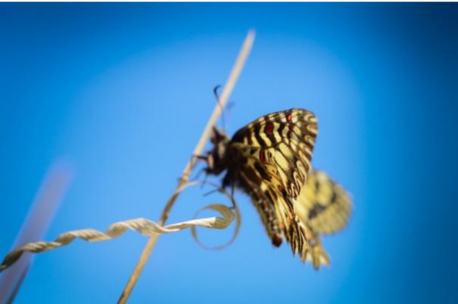
petelinček ( Zerynthia polyxena )